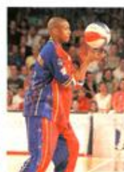
Faire tourner le ballon sur un doigt, le label des Harlem.