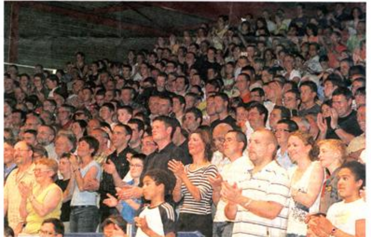
Conquis, le public choletais. Par les prouesses et les facéties des Harlem Globetrotters, en exhibition, hier soir, à la Meilleraie, 25 ans après leur dernier passage dans les Mauges.