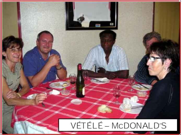
VÉTÉLÉ – McDONALD'S