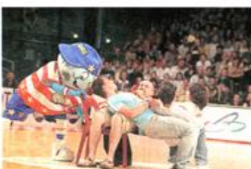
Pendant les temps morts, le spectacle continue. Avec le mascotte des Harlem.