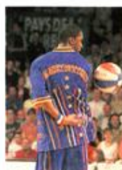
Le show commence à s'accroître.