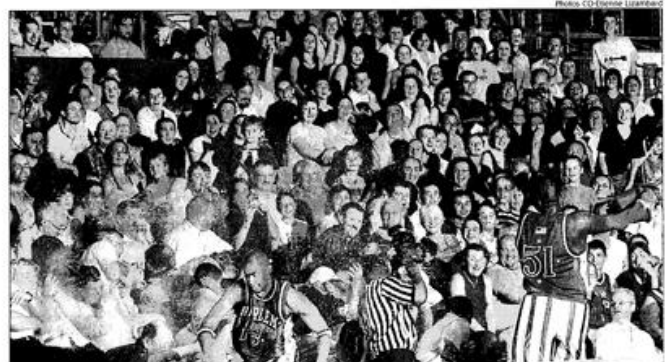
Le public s'est trouvé souvent pris à partie par les basketteurs qui n'ont pas manqué de l'asperger de verres d'eau