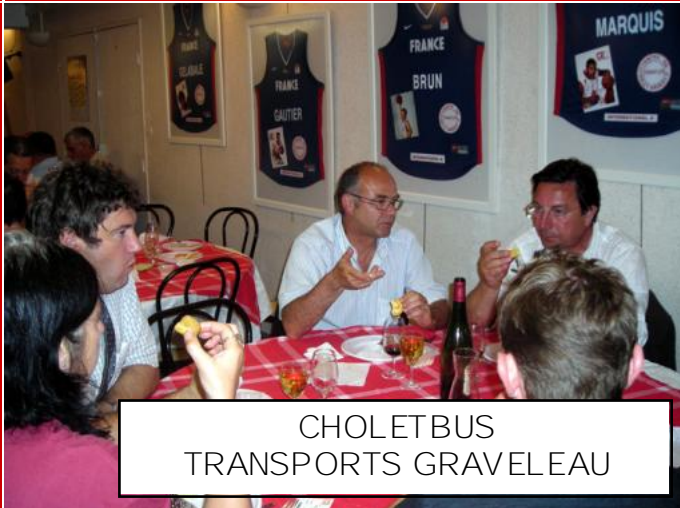
CHOLETBUS TRANSPORTS GRAVELEAU