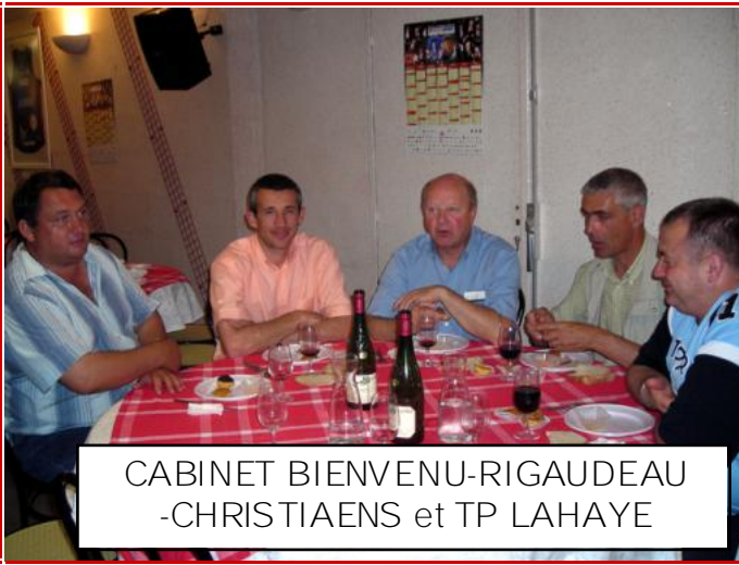
CABINET BIENVENU-RIGAUDEAU -CHRISTIAENS et TP LAHAYE