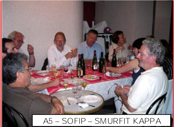
A5 – SOFIP – SMURFIT KAPPA