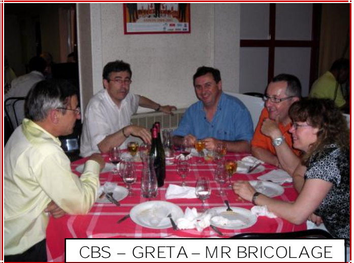
CBS – GRETA – MR BRICOLAGE