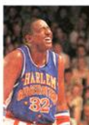
Le basket reste un jeu. Et un prétexte pour faire rire.