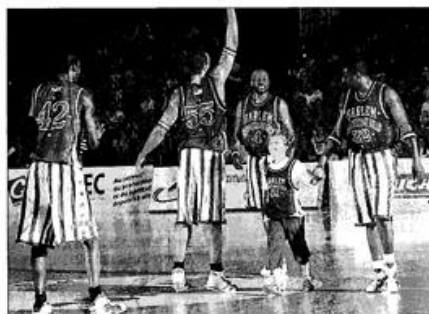
Les Harlem ont fait participer le public à leur show comme ce petit garçon qui, après avoir marqué un panier, est reparti avec le maillot de sa nouvelle équipe fétiche