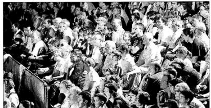
Méduvés, les spectateurs ont assisté aux prouesses techniques et humoristiques des Harlem

Le Courrier de l'Ouest – Samedi 9 juin 2007