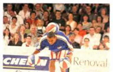
... Qui sont aussi habiles avec trois ballons.