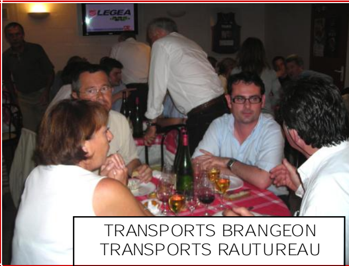
TRANSPORTS BRANGEON TRANSPORTS RAUTUREAU