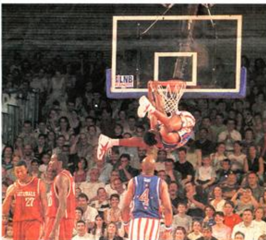
Aussi à l'aise dans les airs que sur les parquets.