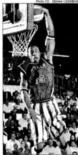
Les Harlem Globetrotters, tout sous contrôle

Américains jusqu'au bout Niveau marketing, les Globetrotters ne sont pas en reste. 79 € le maillot, 25 pour un simple t-shirt, 45 pour un simple ballon, 8 pour le programme... Cher, mais pas tant que ça, à voir ces gens qui reviennent en catastrophe pour acheter un fanion dans une Meilleraie vide depuis