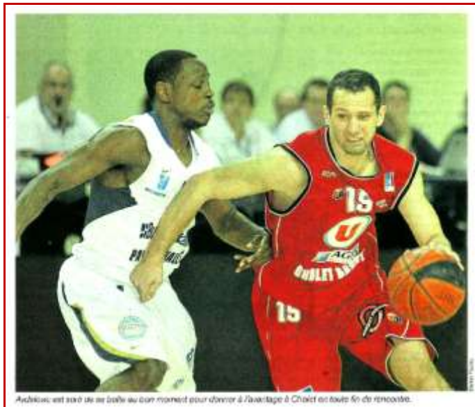
AvdaloVIC est sorti de sa traîne au bon moment pour donner à Cholet ce tout fin de remontée.