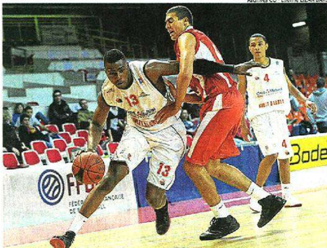
Cholet, la Meilleraie, avril 2012. Les meilleurs cadets du monde entier seront en compétition du 29 mars au 1 er avril.