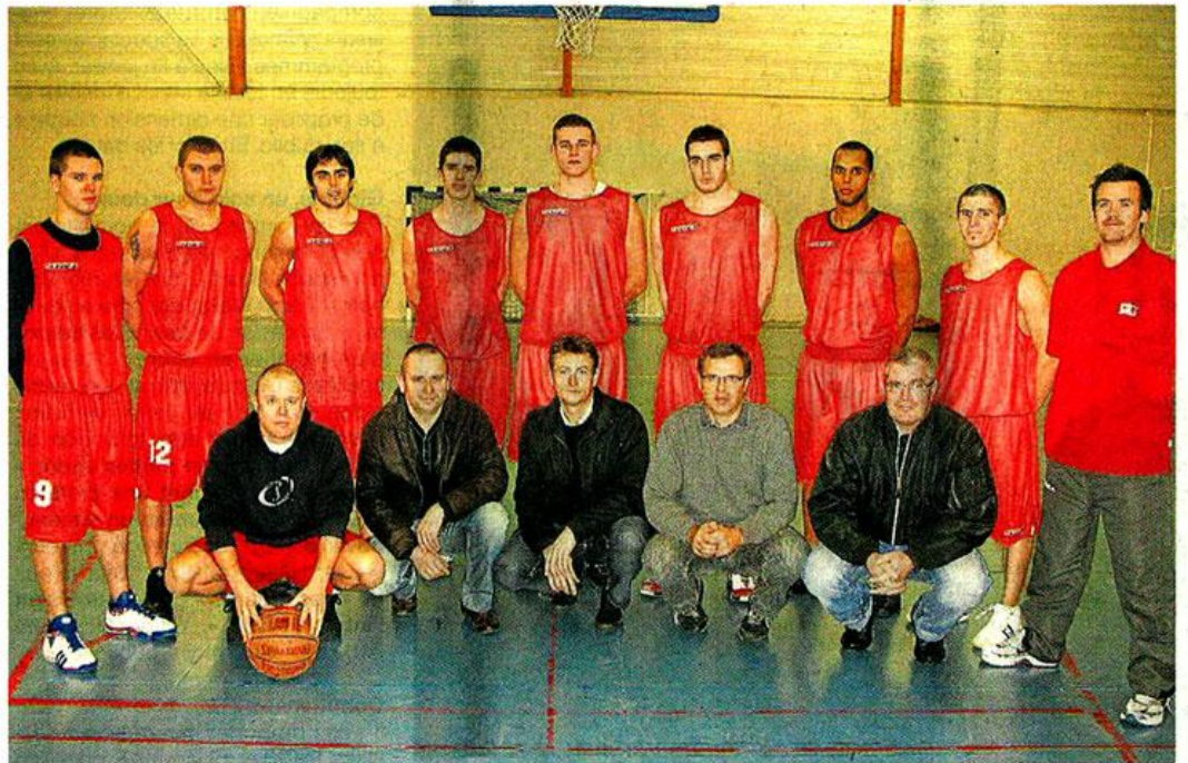
L'équipe première masculine de l'association Cholet-basket, ici salle Demiannay, avec ses cinq responsables d'équipe (au premier rang), veut sortir de l'anonymat.

Son objectif est ainsi de « monter au moins jusqu'en N3 (le dernier et 5 e niveau national). Au club, il y a des minimes et des cadets évoluant en championnat de France. Au lieu que ceux qui n'arrivent pas à devenir pros partent ailleurs, proposons-leur un bon niveau au sein