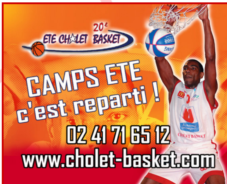
20 e CAMP ETE CHOLET BASKET Juillet 2007