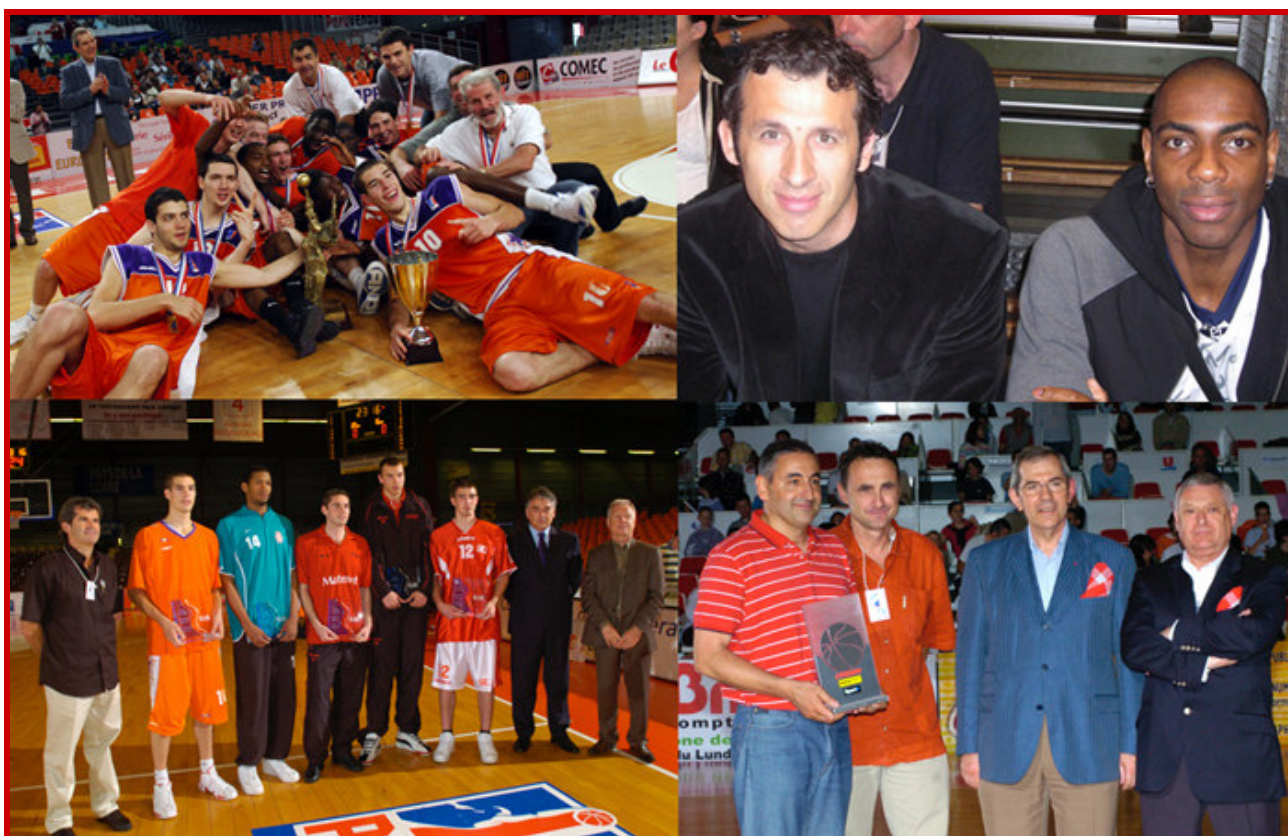
TROPHÉE DU FUTUR – 25,26 et 27 mai 2007 à la Meilleraie