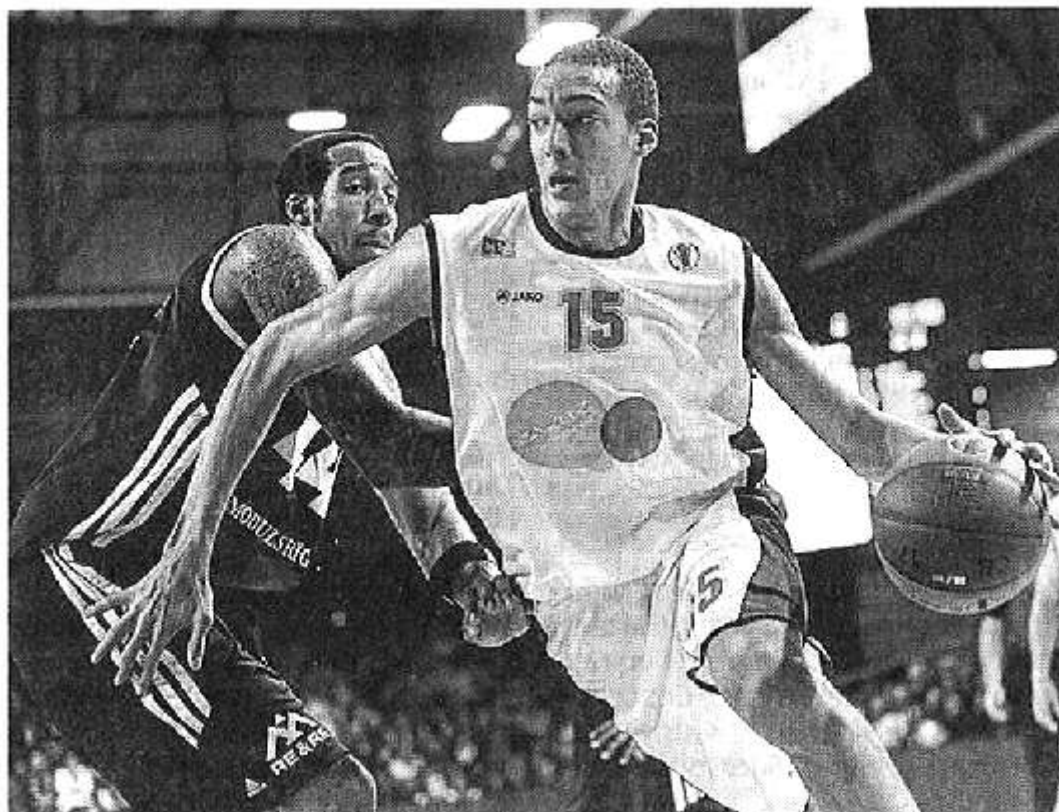
Cholet Le Meilleraie. Hier, Cholet et CB ont endossé la tête.