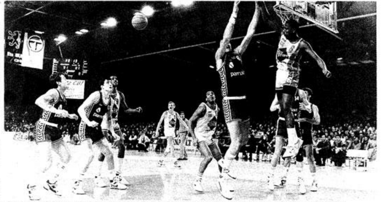
17 janvier 1989, Cholet accueille le Real Madrid. 7 000 personnes se serrent à la Meilleraie pour ce qui reste le record d'affluence du club.

Samedi, à 17h : Handisport choletais (Nat 1) / Lannion Handisport (Nat 1B) ; à 19h, STB Le Havre / Banvit BC ; à 21h, Cholet Basket / Atlas Stal Ostrow, Dimanche, à 15h, STB Le Havre / Atlas Stal Ostrow ; à 17h, Cholet Basket / Banvit BC.