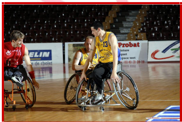
Handisport Choletais/Lannion Handisport Samedi 22 septembre 2007