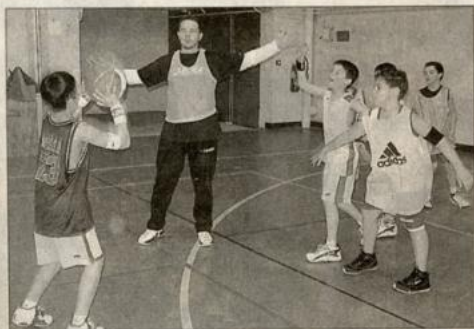
A l'atelier passe, les enfants doivent se passer le ballon sans dribbler. La première équipe à dix remporte la victoire