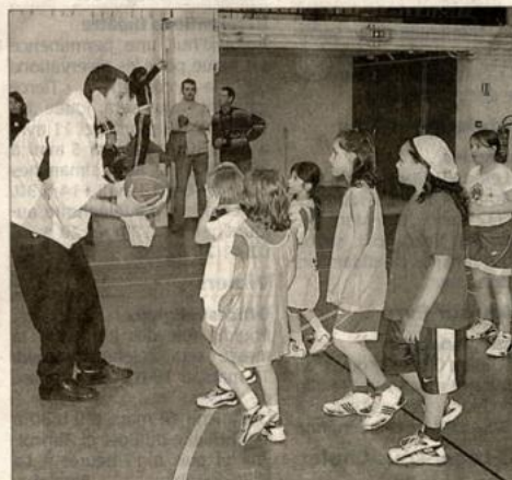
Les enfants ont écouté, avec attention, les conseils dispensés par leurs aînés, tout au long de l'après-midi

Une soixantaine d'enfants ont partagé, hier, un après-midi basket avec les joueurs professionnels de Cholet Basket.