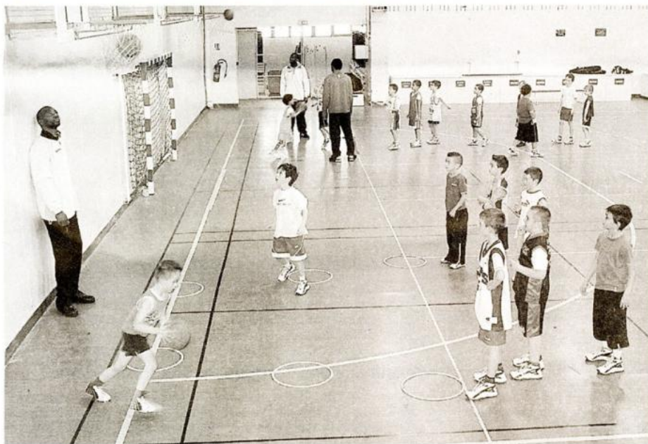
65 enfants ont partagé un entraînement avec les professionnels de Cholet-basket.

Mercredi après-midi, en lieu et place du traditionnel entraînement, les 65 enfants de 8 à 11 ans de l'école de basket de Cholet-basket étaient réunis salle Du Bellay pour une séance avec les professionnels, organisée chaque année.