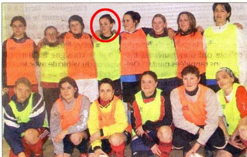
Des ballons et chasubles colorés pour l'équipe des seniors féminines

En guise d'encouragement au développement du football féminin, la Ligue Atlantique de football a remis, vendredi soir, une dotation à l'équipe féminine des seniors.