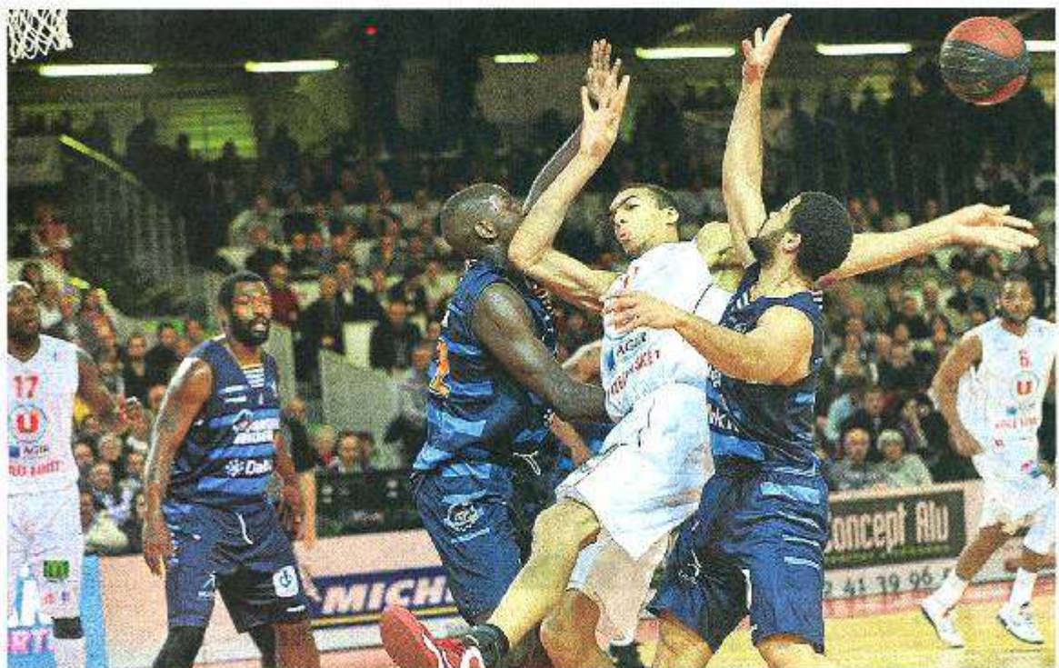
Cholet, La Meilleraie, hier soir. Les Choletais à l'image Rudy Gobert n'étaient pas si loin de battre l'ogre de la Pro A, Gravelines.

Les Choletais sont passés tout près d'une victoire référence, hier soir, face à Gravelines. Mais au bout du compte, il y a défaite, une de plus. Inquiétant au classement, mais dans le jeu, il y a eu du bon.