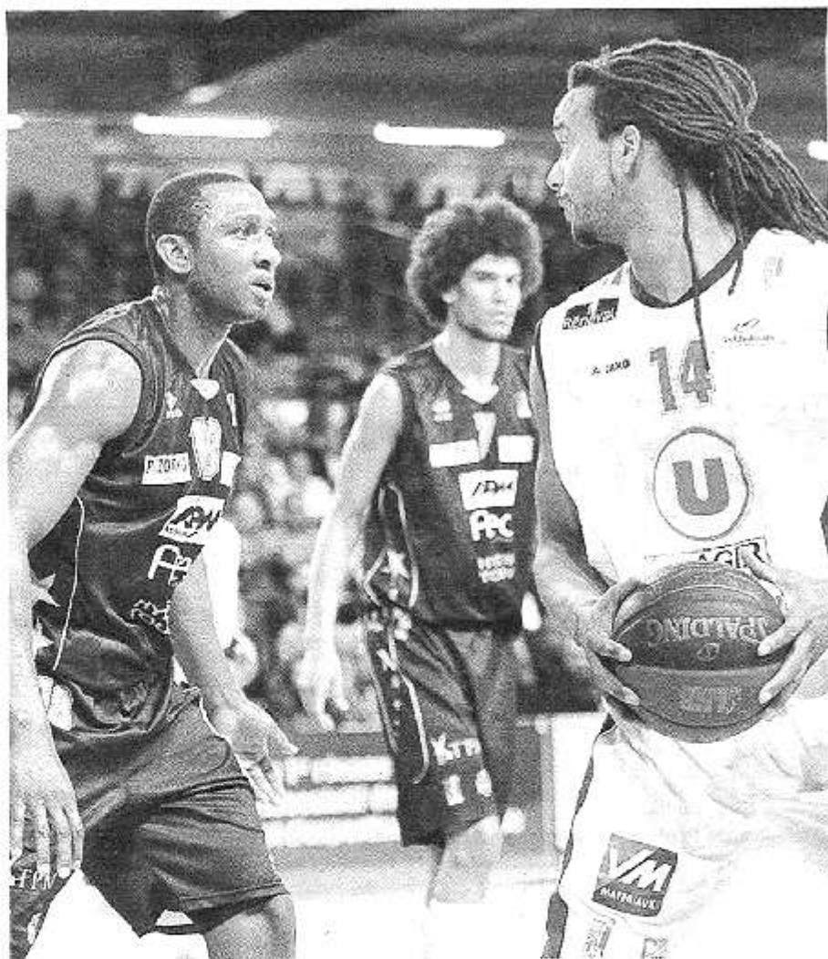
Falke et les Choletais se sont imposés grâce à un quatrième quart-temps exceptionnel.

L'entraîneur nanterrien promène une certaine bonhomie qui en fait un interlocuteur très attachant. A l'avis de combien autorisé également : il a démontré toute la palette de ses compétences en faisant progresser son club de la D1 départementale à la Pro A, entre 1987 et 2011. Alors, quand il se confie, on l'écoute sans doute plus que