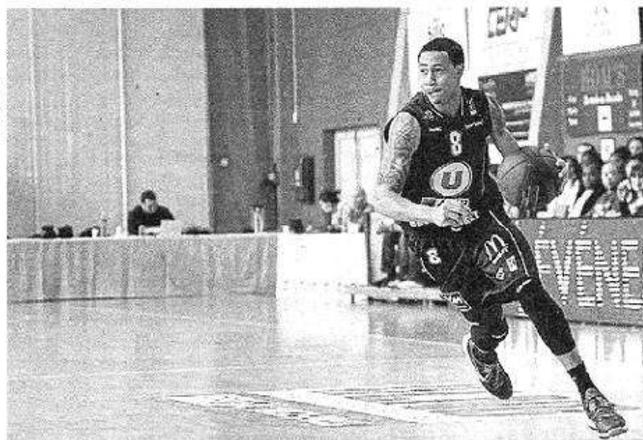
AJ Slaughter a pourtant délivré une nouvelle partition intéressante. Mais CB enregistre son deuxième revers de la saison contre Nanterre.

« Il est plus facile d'entraîner à Nanterre qu'à Cholet en ce moment »