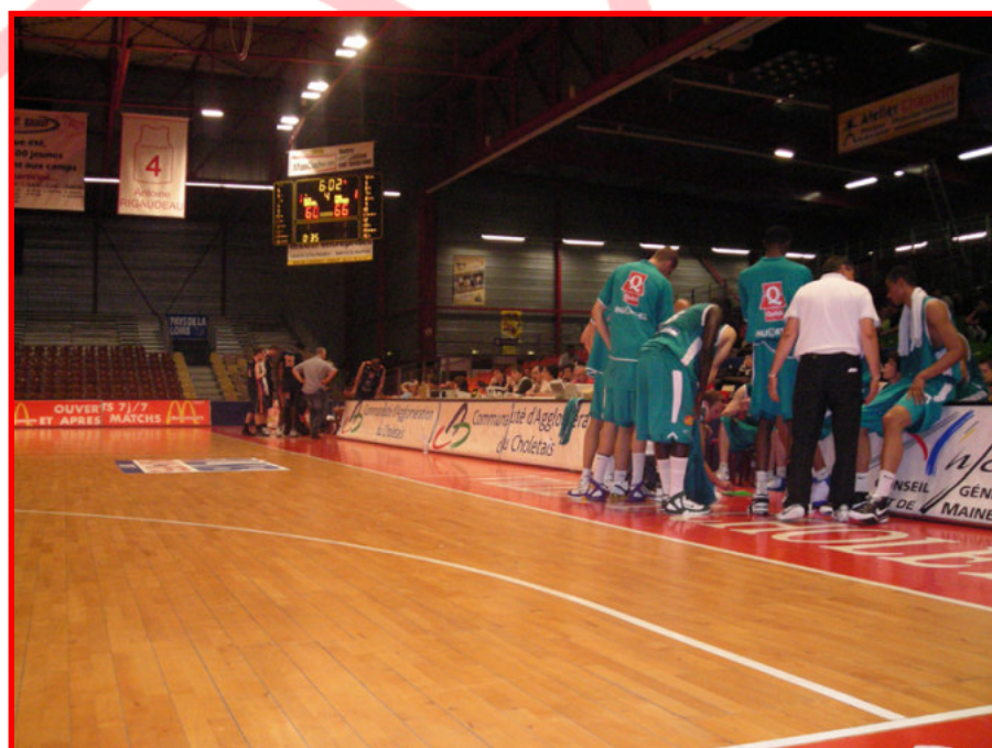
Victoire de Pau Orthez face aux nordistes de Gravelines Dunkerque 70 – 74 après un match disputé