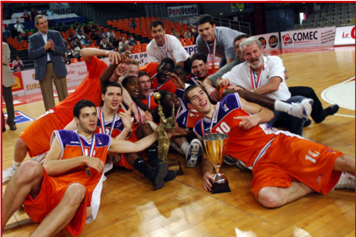
LE MANS, vainqueur du TROPHEE DU FUTUR 2007