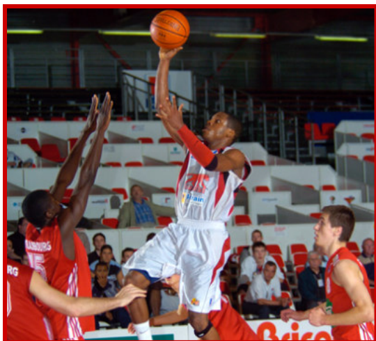
Lancement du Trophée du Futur 2007 avec la rencontre SLUC NANCY : STRASBOURG IG