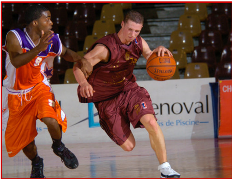
Victoire du Mans face à Dijon , équipe vainqueur du Trophée du Futur en 2006