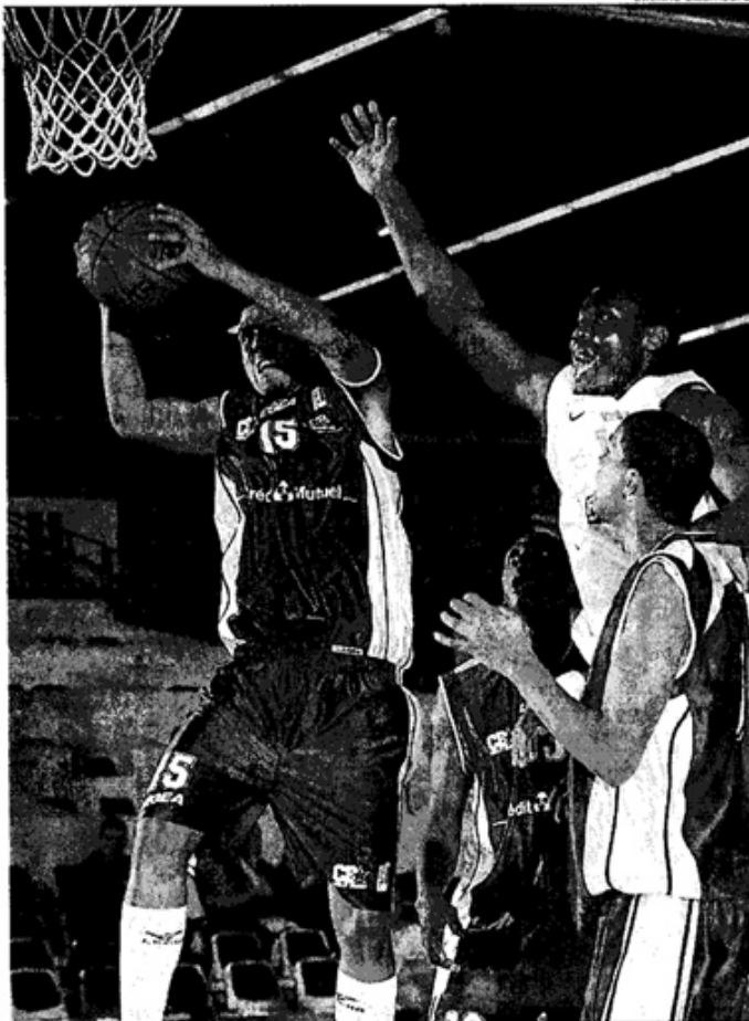
Les futurs stars du basket vont évoluer sur le parquet de La Meilleraie