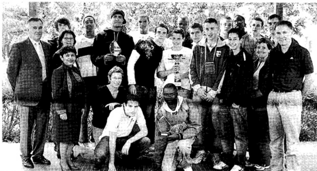
Les basketteurs du lycée Europe garderont ces championnats en mémoire pendant longtemps.

Les basketteurs ont décroché les titres cadets et juniors aux championnats de France UNSS.