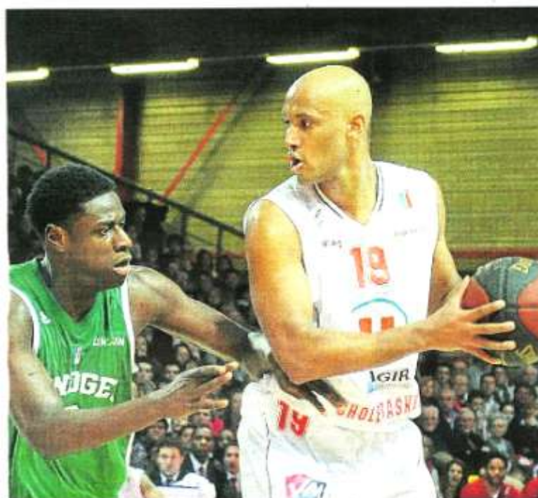
Vainqueurs de Limoges, les Choletais sont enfin parvenus à enrayer leur mauvaise spirale.