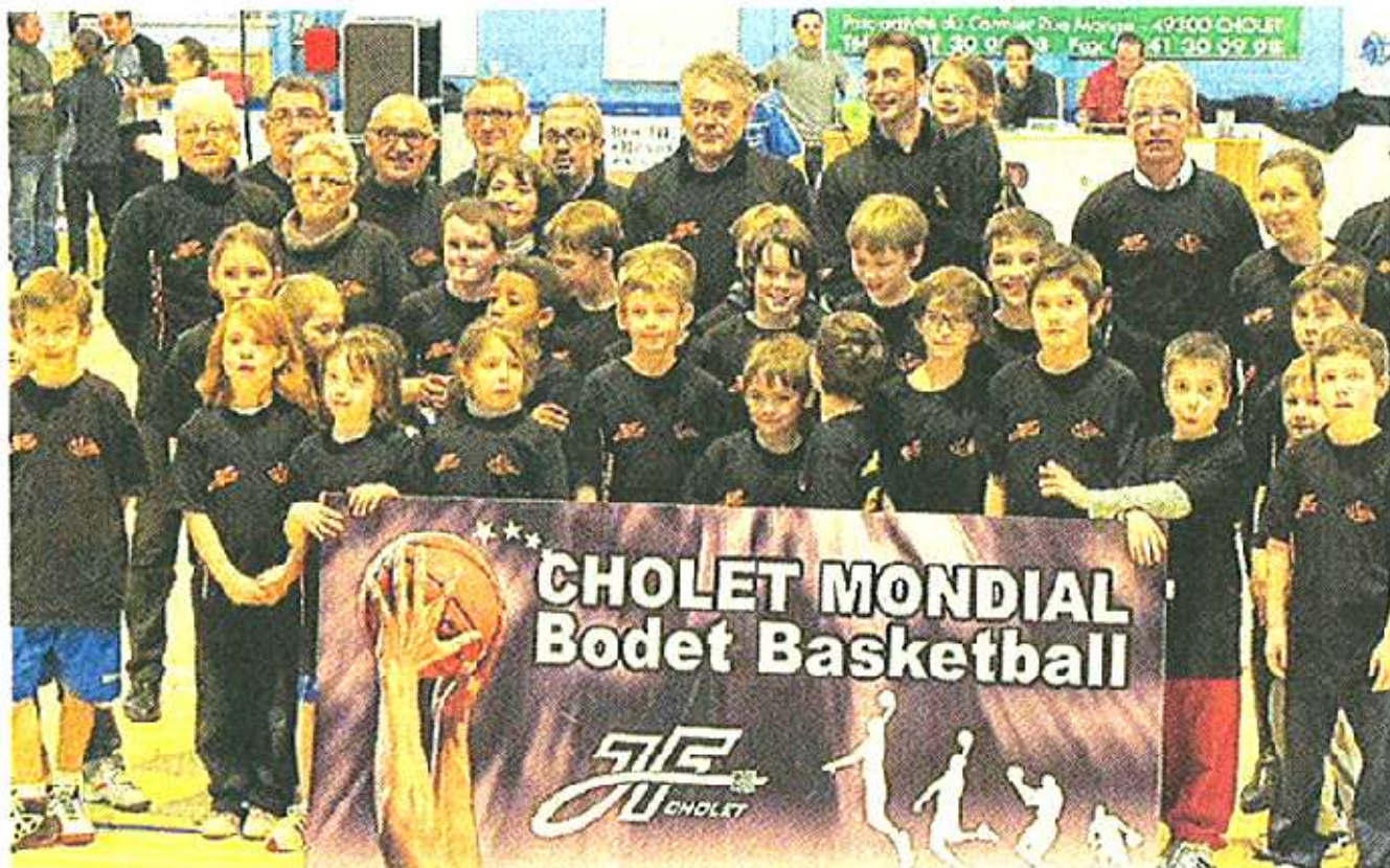
Cholet, 20 janvier. Le décompte du temps séparant la Jeune France du Cholet Mondial Bodet basket-ball a été lancé.