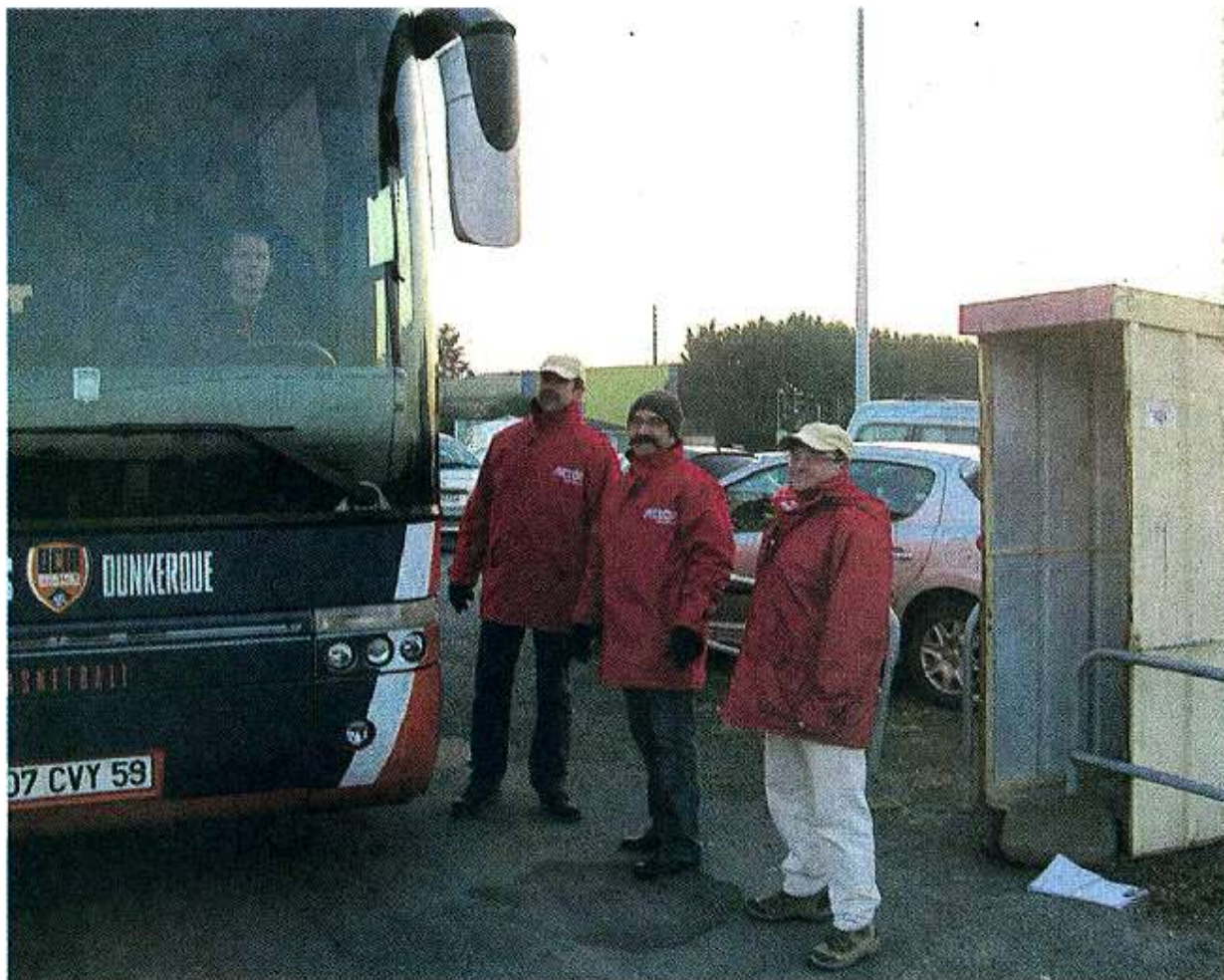
Cholet, parking de la Meilleraie. Tous les véhicules s'arrêtent au contrôle, même le bus transportant l'équipe visiteuse.

Tous les bénévoles de Cholet Basket ne sont pas dans la salle lors des rencontres. Lionel Godreau, Thierry Biteau et Yvon Godard contrôlent l'accès et placent les véhicules sur les parkings.