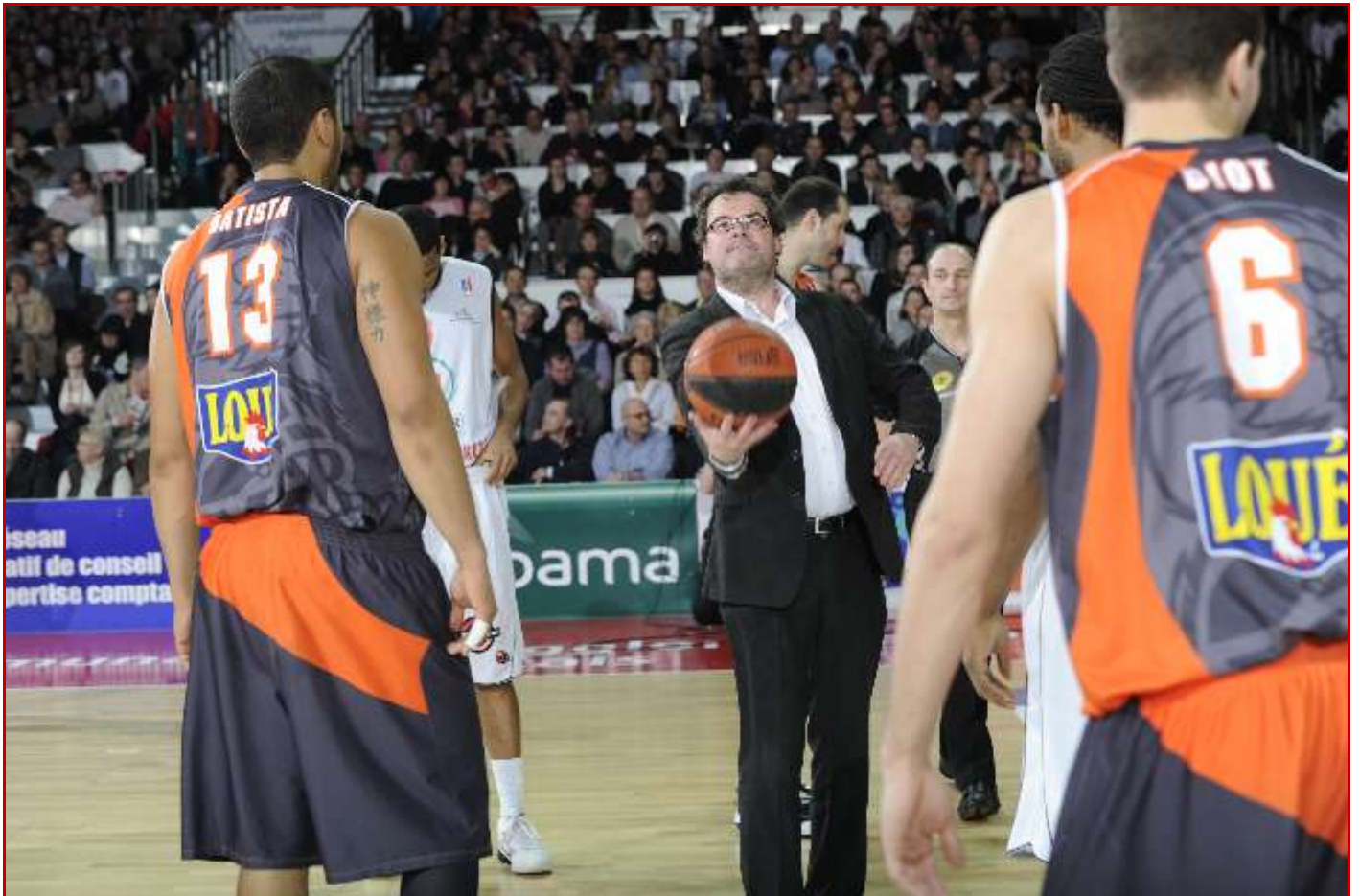
Monsieur Gildas GUGUEN, Conseiller Régional des Pays de la Loire a donné le coup d'envoi de cette rencontre.