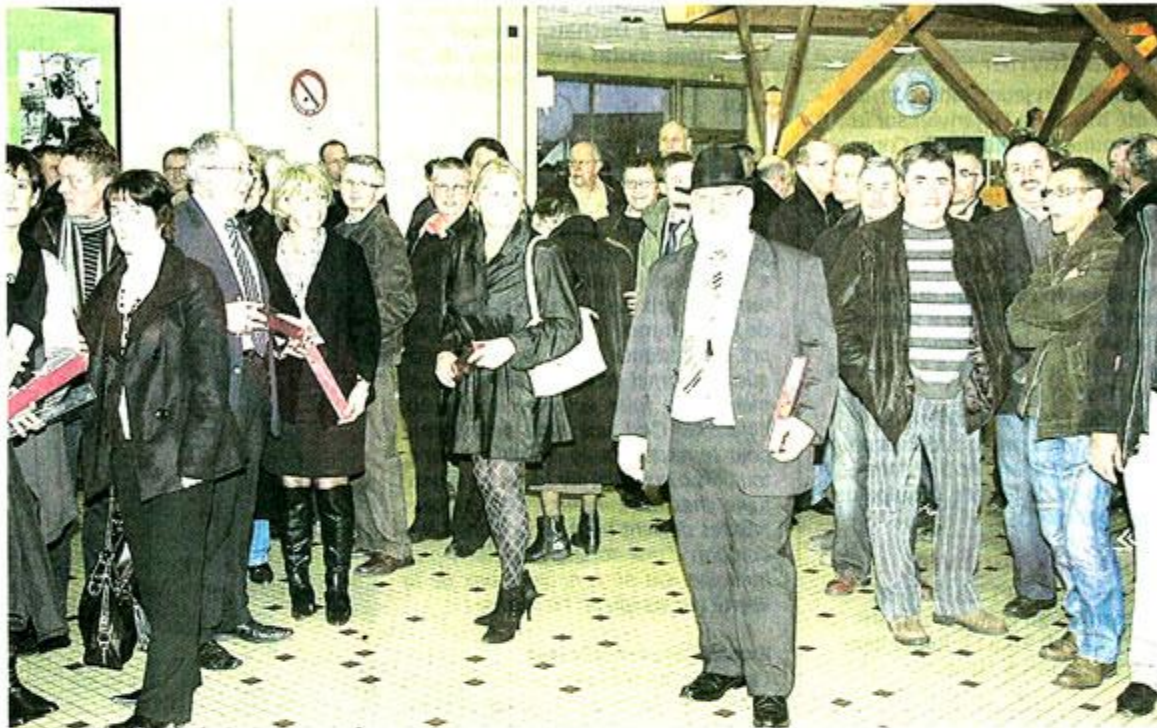
Cholet, vendredi 16 janvier. 66 salariés de la société Nicoll ont reçu leur médaille du Travail.

66 salariés de l'entreprise Nicoll ont reçu hier soir leur médaille du Travail dans un contexte qui s'annonce plus difficile que l'année 2008.