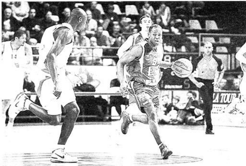
Les performances de Mokongo et des Choletais sont pour le moins teintées d'inconstance.

L'une et l'autre problématiques méritent probablement qu'on leur réponde par l'affirmative. Oui, le niveau de la Pro A baisse régulièrement. Les piètres performances françaises en coupes d'Europe le confirment chaque saison un peu plus vertement. Cholet demeure la dernière équipe tricolore qualifiée en compétition internationale ? C'est vrai, et c'est tout à son honneur. Mais il convient là encore de se poser la bonne question : l'Eurochallenge est-il au niveau de la Pro A ? Pas si sûr, tout au moins dans sa phase de poule, que vient de conclure Cholet invaincu. Et oui : CB, dans le chariot de queue en championnat, dicte sa loi en coupe d'Europe, signe tangible s'il en est du niveau de la compétition continentale. Avec le top 16, l'équipe des Mauges va seulement entrer dans le vif du sujet. Et pour tenir la vedette sur la scène européenne comme elle l'a