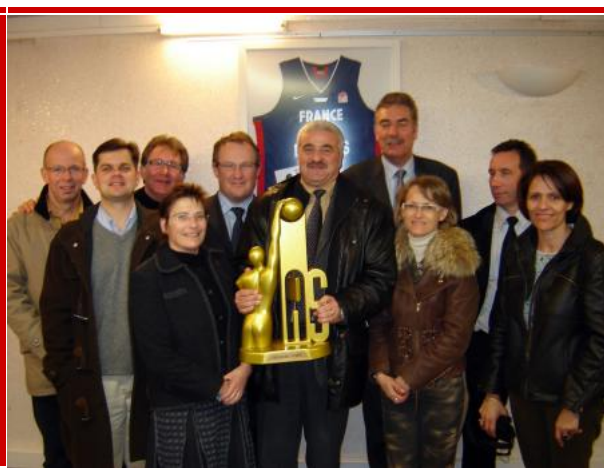
Les membres de l'association en photos avec l'équipe professionnelle et le Trophée de la Semaine des As.