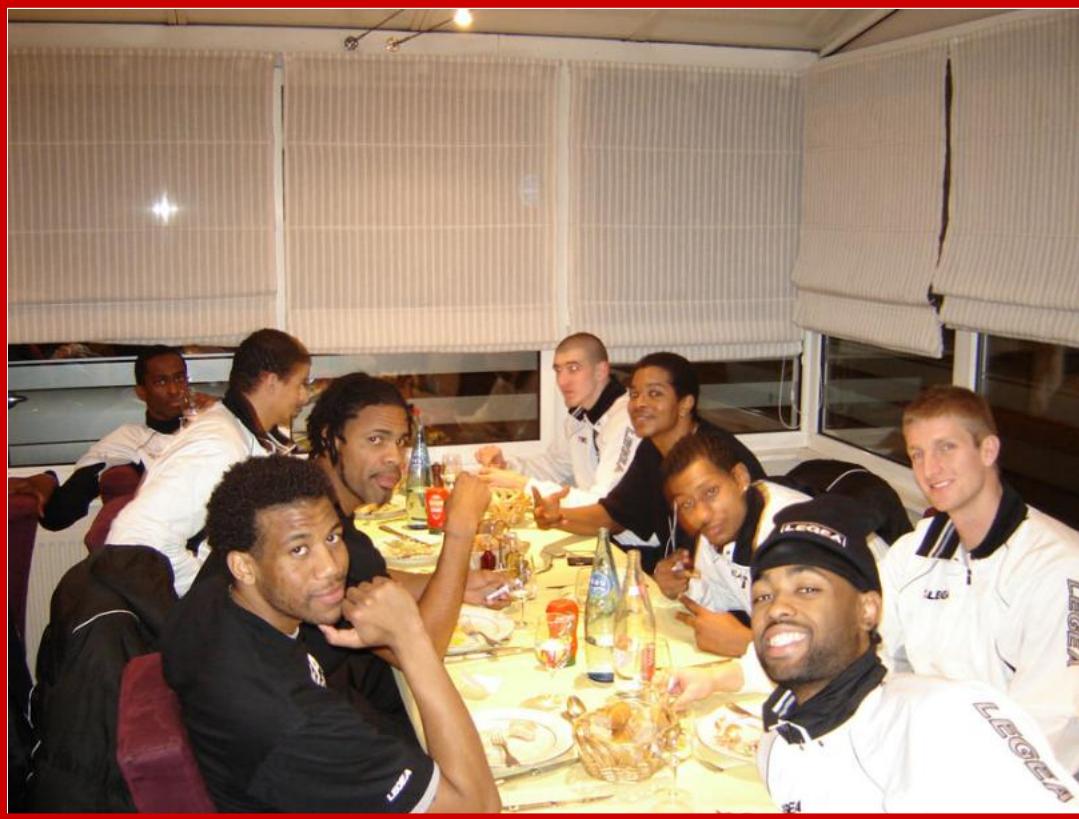
Les joueurs à table et heureux d'avoir remporté le match face à Dijon.