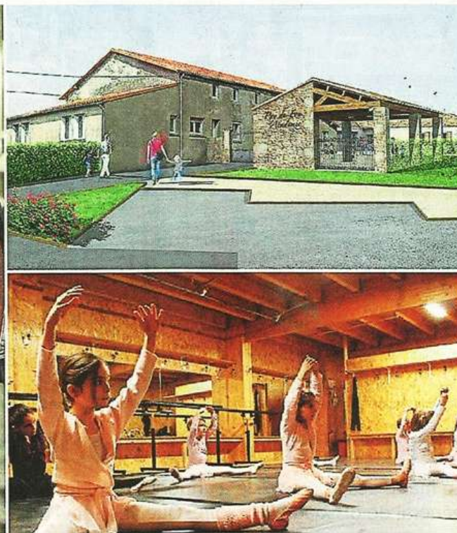
Dans la future Puy du Fou Académie (en haut à droite), les enfants pourront pratiquer notamment le chant et la danse.