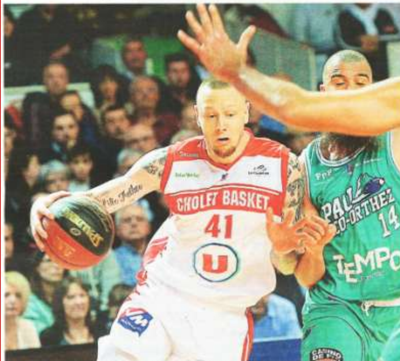
Après avoir souvent mené, Cholet a vu le succès lui échapper in extremis face à Pau-Orthez (78-79), page 12