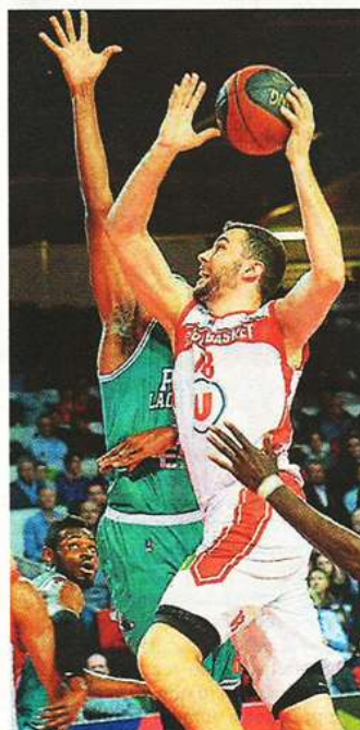
Alors qu'ils ont souvent fait la course en tête, De Jong et les Choletais ont concédé une nouvelle défaite face à Pau.

PAU-ORTHEZ : Robinson (7), Sylla (8), Simonovic (14), Bokolo (8), Dillard (11), Denave (14), Bronchard (5), Ere (6), Cain (6).