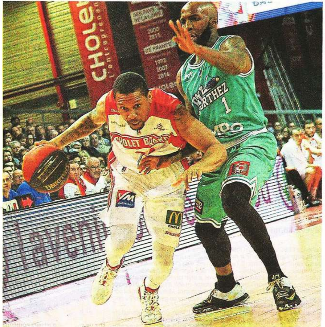
Cholet, La Meillaie, hier. Une perte de balle de Banks aura permis à Pau de l'emporter.

Comment expliquer une telle absence, alors que jusque-là, sans être transcendants, les joueurs des Mauges, en tête à chaque fin de quart-temps, avaient correctement rempli leur office ? « Je ne sais pas », répond Buffard, un brin désabusé. Le coach choletais espérait pouvoir