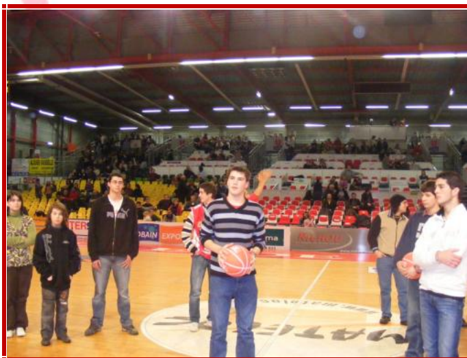
Les jeunes lors de ce concours des MFR