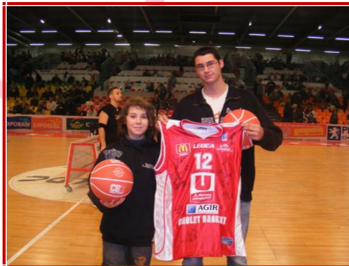
A droite, les étudiants de la MFR de LEGE (44), vainqueurs de ce concours