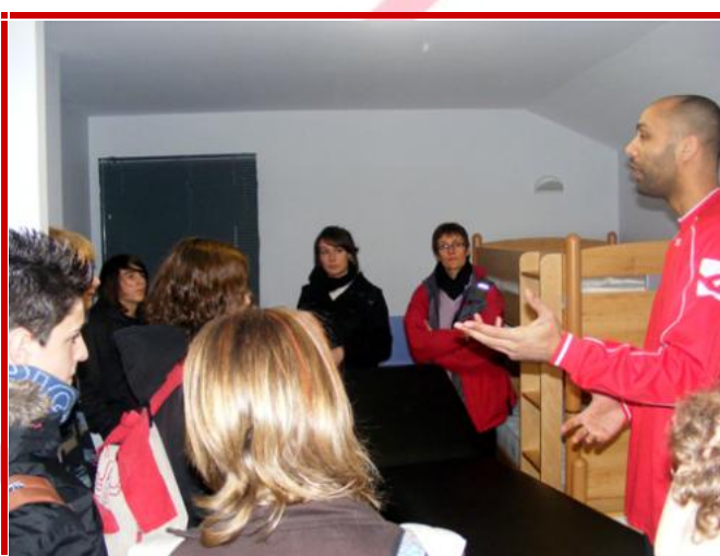
Visite des chambres, salle de réunion et salle de vie du Centre d'Hébergement.