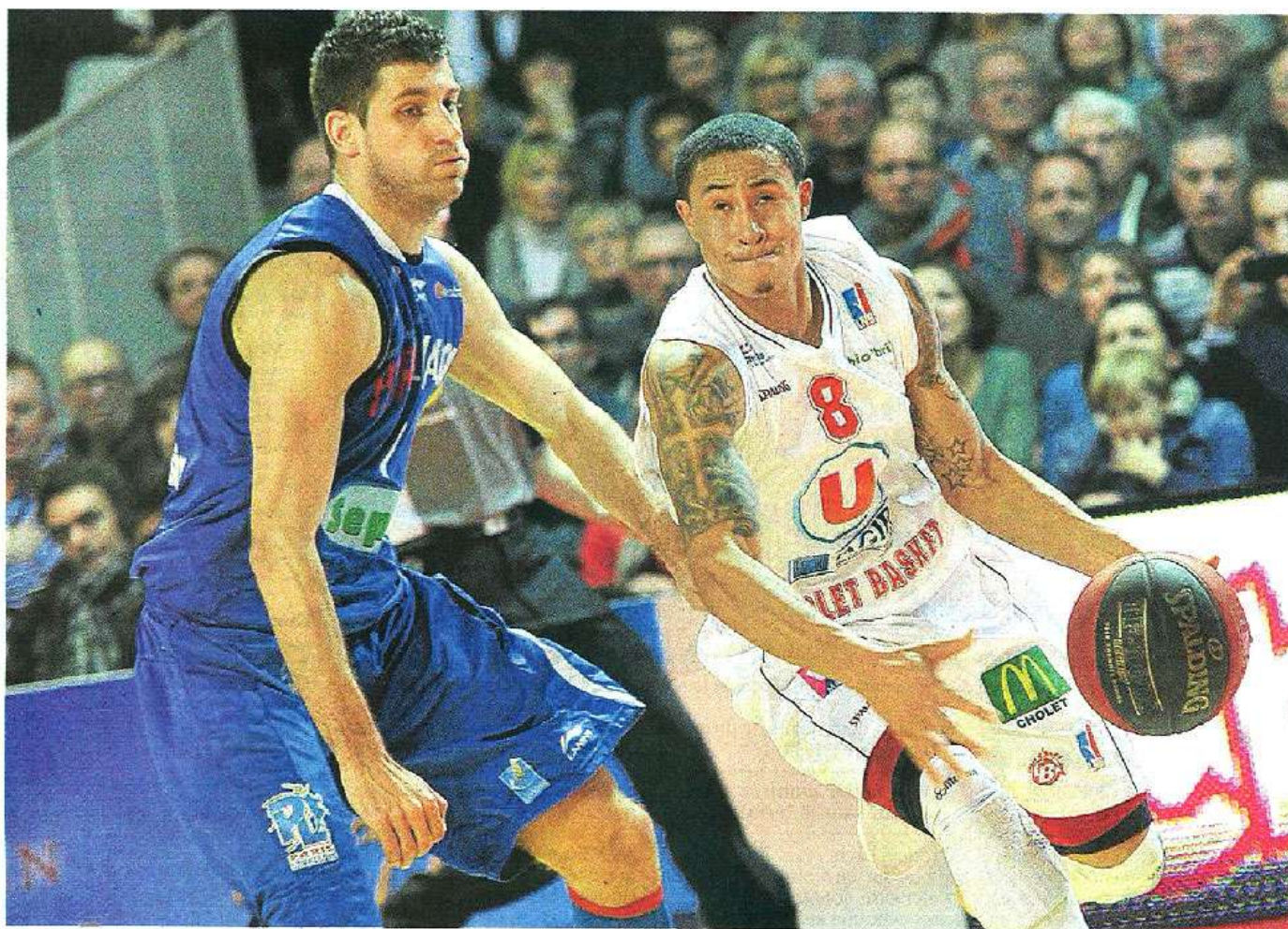
Cholet, La Meilleraie, hier soir. Le Choletais Slaughter malgré ses 12 points n'a rien pu faire pour éviter la défaite de son club.

Cholet Basket est passé complètement à côté de son match, hier soir, face à Paris-Levallois. Une défaite synonyme de non-qualification pour la Leaders cup. Une soirée noire qui pourrait laisser des traces.