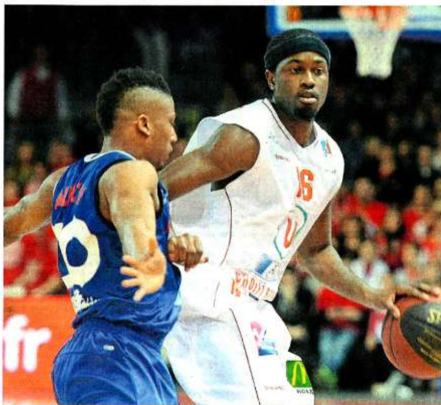
Battu par Paris-Levallois, CB a laissé filer le dernier visa pour la leaders Cup à Disney.