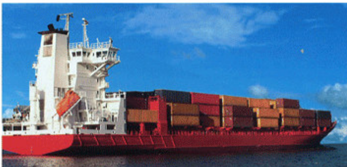
Gravelau Air & Sea Logistics : une success story à la française