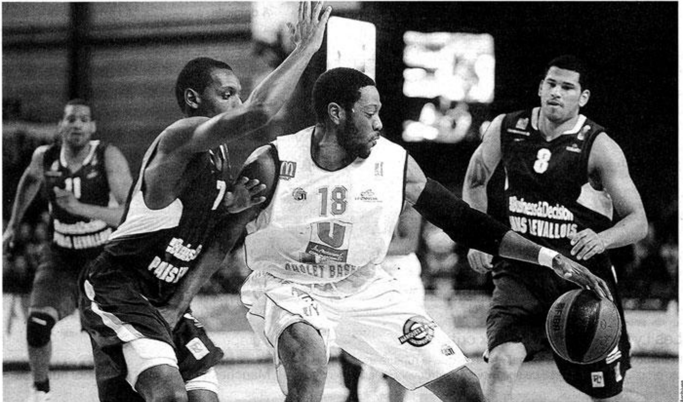
Robinson et les Choletais terminent l'année sur un succès. Ils restent donc bien installés en haut du classement de Pro A.

Pro A. Chalon-sur-Saône - Cholet : 70-78. Après une entame très moyenne, Cholet a réussi un excellent deuxième quart-temps, qui lui a ouvert le chemin du succès.