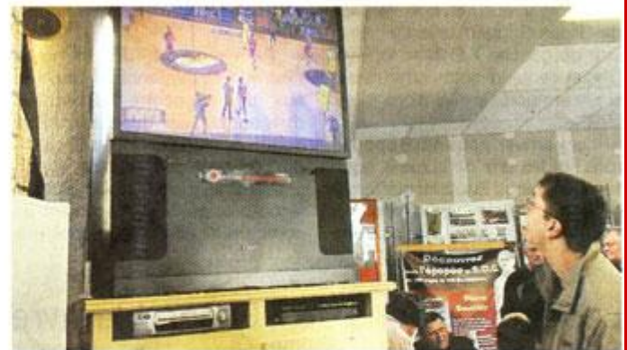
Scotchés devant l'écran, les supporters du Soc ont fêté l'exploit de CB.