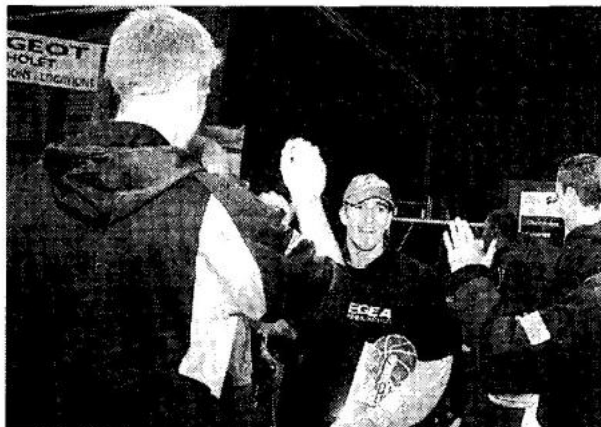
Les jeunes du centre ont accueilli les pros par une haie d'honneur. Ici, Nando de Colo qui, il y a deux ans, se trouvait à leur place. Tout un symbole.