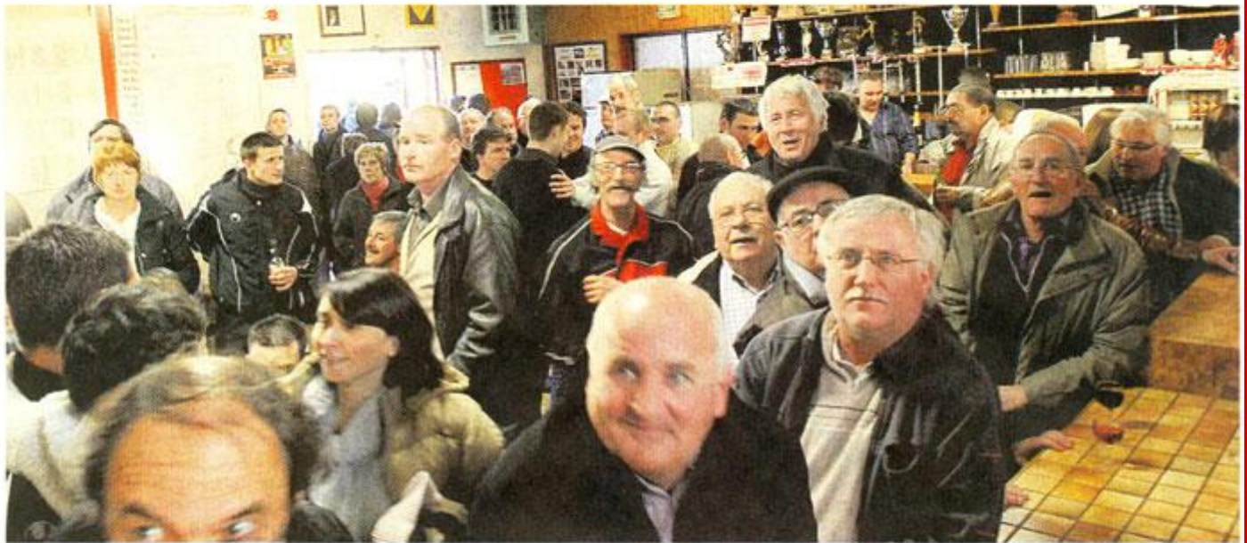
La foot qui vibre pour le basket. C'était hier après-midi, dans le club house du Soc. Après le match, 70 personnes ont allumé la télé pour assister à une victoire historique pour Cholet.

A Toulon, le club a déjoué les pronostics pour remporter la Semaine des As. Un exploit qui fera date. Les supporters le fêteront aujourd'hui avec les joueurs.