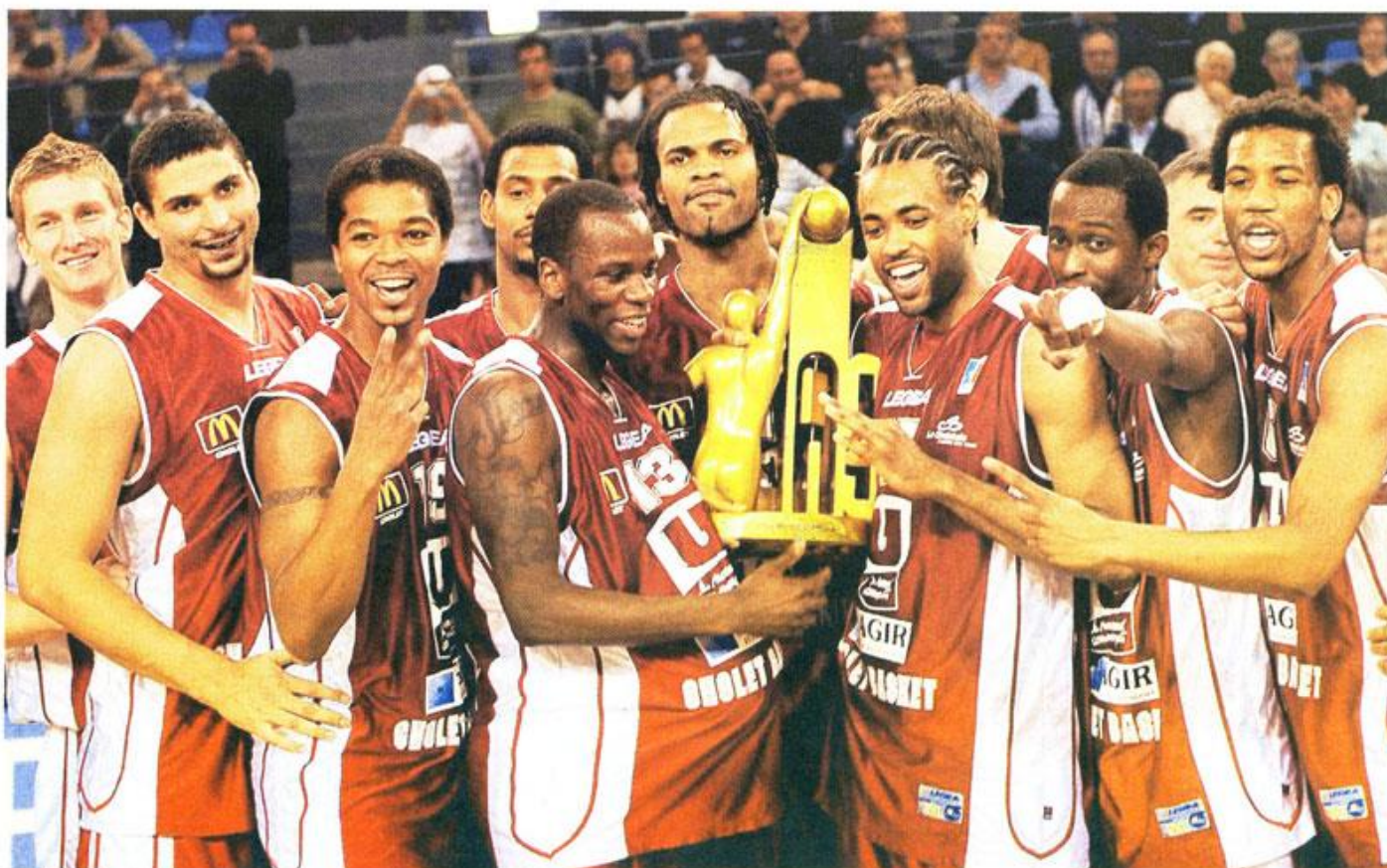
La joie des Choletais qui ont remporté haut la main la finale des As, hier après-midi, face à Vichy.

Semaine des As. Vichy - Cholet : 40-67. Les Choletais ont balayé des Vichyssois à la maladresse extrême et remportent leur premier titre majeur depuis 1999. Chapeau bas !