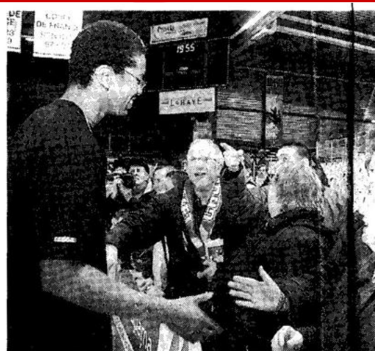
Les joueurs ont fait un tour d'honneur.