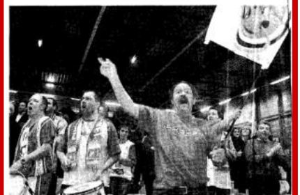
Le C'Bulls, le club de supporters de Cholet-basket, a donné de la voix à l'entrée des joueurs sur le parquet. Ils promettent de « faire un truc » contre Le Havre, dans 15 jours, date du prochain match à domicile.