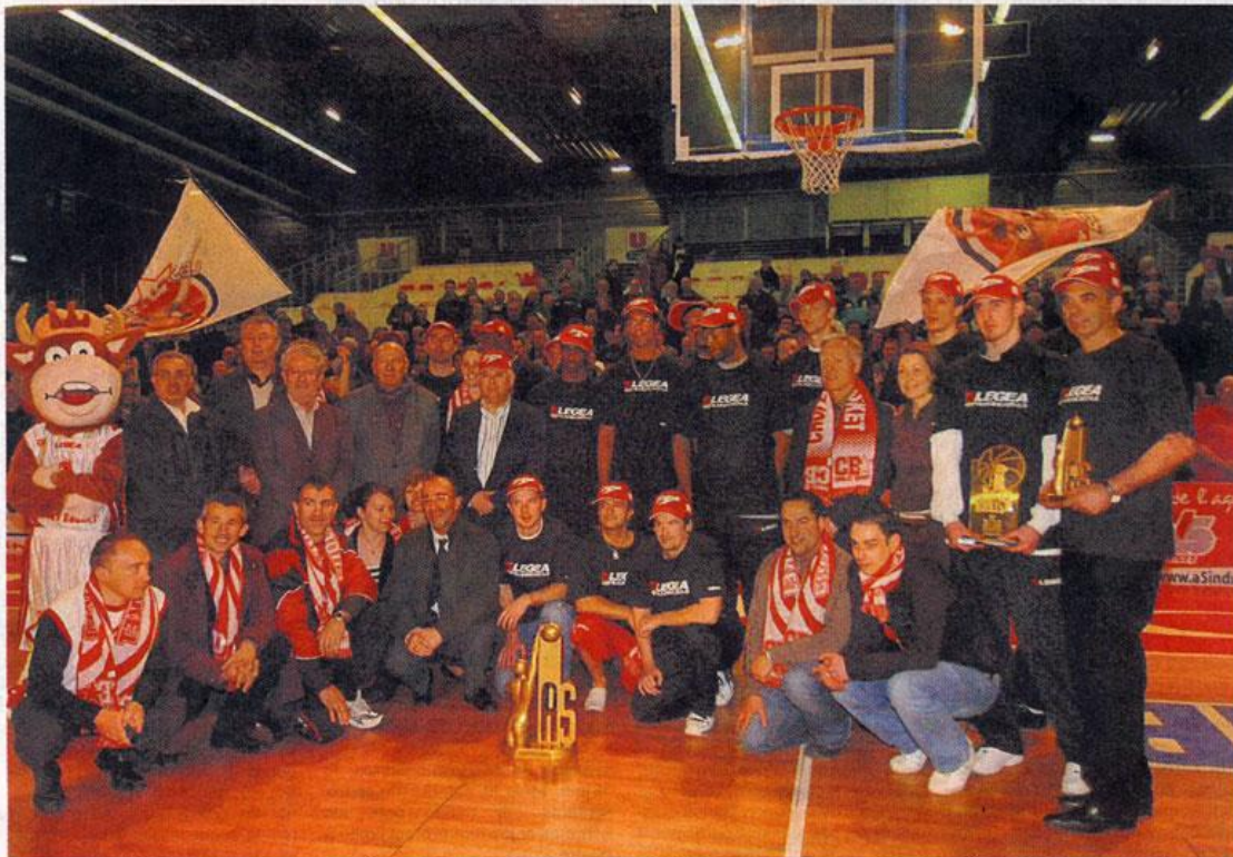
Hier soir, à La Meilleraie, les joueurs et le staff choletais ont présenté leur trophée à leurs supporters. En attendant d'autres ? Réponse au printemps.

Pro A. L'euphorie n'a pas véritablement touché le vainqueur de la semaine des As. Son succès l'a surtout rendu plus ambitieux.