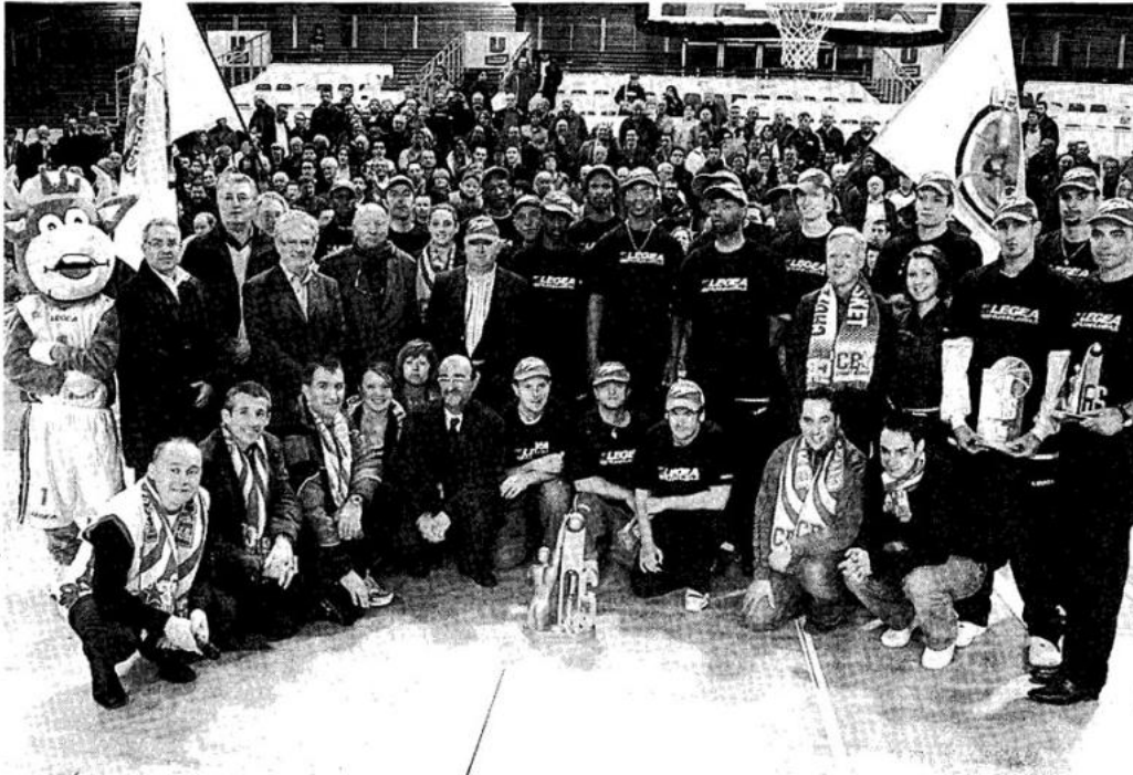
Joueurs, membres du staff, dirigeants et partenaires posent pour la photo souvenir devant le public de la Meilleraie. La salle pourra désormais accrocher un nouvel étendard.