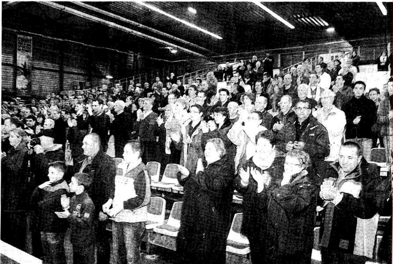
Dans la salle de la Meilleraie, plus de 400 personnes sont venues partager le titre avec les joueurs de Cholet-basket. Un instant attendu depuis 33 ans. Que du bonheur.