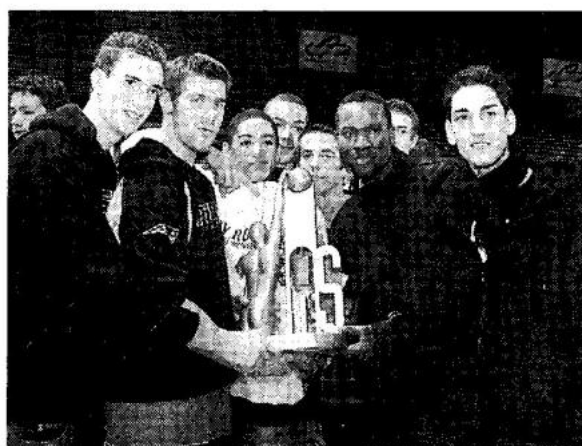
Les jeunes du centre de formation posent avec le trophée des As.