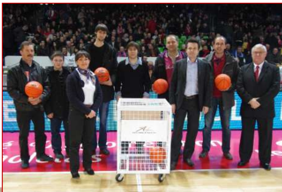
Remise symbolique d'un chariot à ballons pour les présidents des 5 clubs (le May sur Evre, le Plessis-Grammoire, le Longeron, Longué et Avrillé)