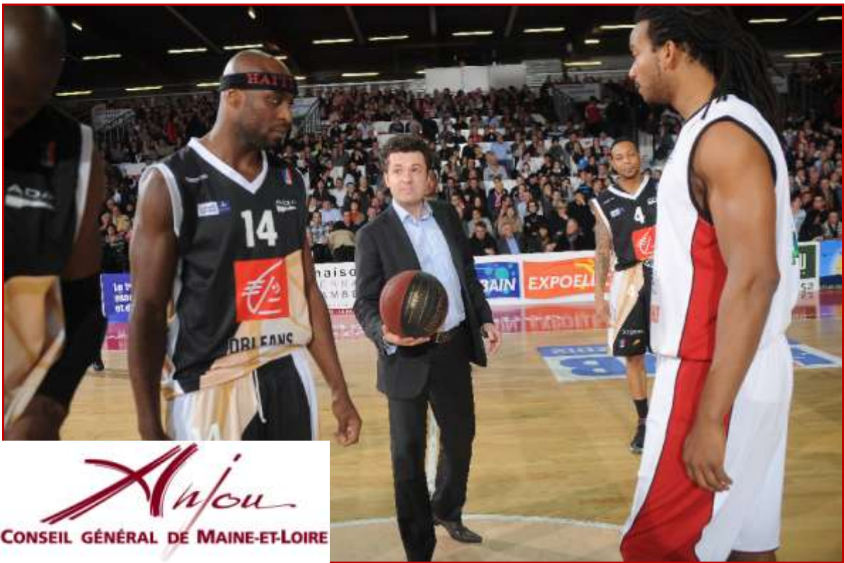
Monsieur Christophe Béchu, Sénateur de Maine-et-Loire, Président du Conseil général de Maine-et-Loire a donné le coup d'envoi de cette rencontre.