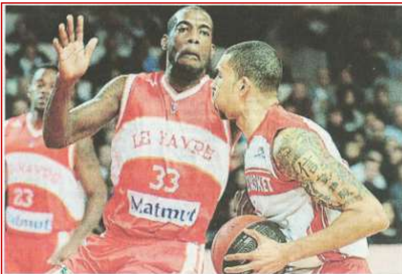
Pour Cholet, cela va de mal en pis. Cholet Basket a concédé sa 5 e défaite consécutive samedi soir en perdant contre Le Havre 79 à 84. Encore une désillusion pour les supporters choletais qui néanmoins ne se sont pas montrés véhéments.