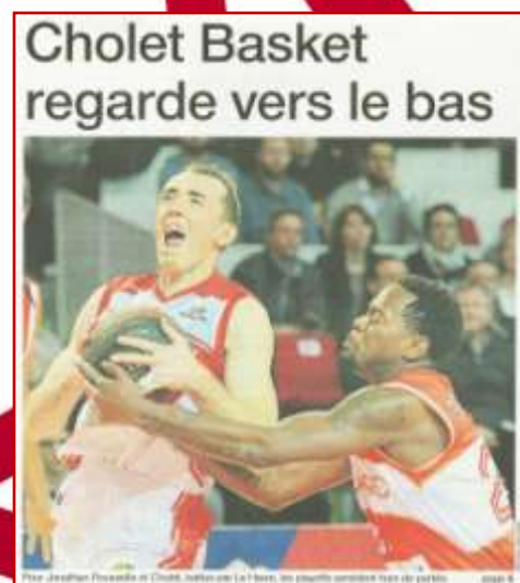
Ouest France – Lundi 9 février 2015