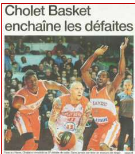
Ouest France – Dimanche 8 février 2015