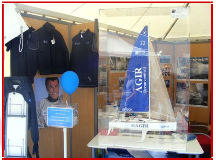
Le stand AGIR RECOUVREMENT