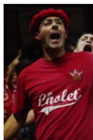
Le public a chauffé la salle de la Meilleraie