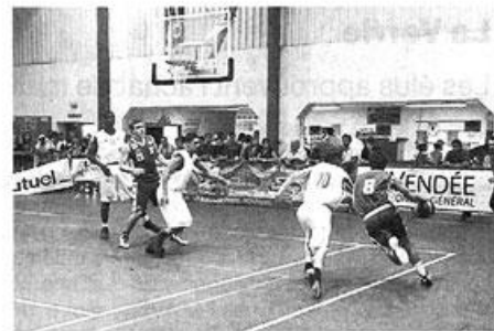
La première demi-finale samedi soir à Treize-Septiers : Cholet - Anvers.