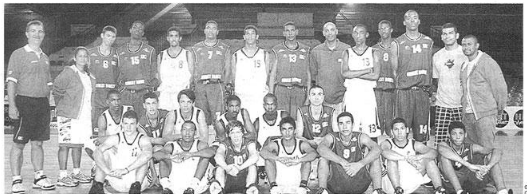
L'équipe de La Réunion (en blanc) a perdu jeudi avec les honneurs contre les cadets du Cholet Basket (en rouge).

Eux, ils se sont contentés d'affronter les cadets. Mais ils ont tout de même assisté à l'entraînement des grands : « On apprend vraiment en les regardant, confie Bastien, l'un des jeunes basketteurs. Ce sont des modèles.