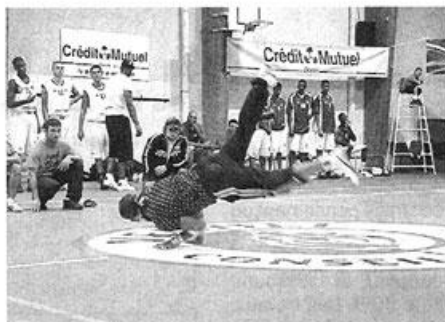
Le hip-hop choletais samedi soir à Treize-Septiers.