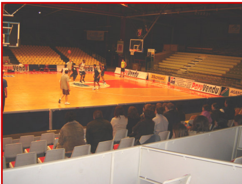
Les jeunes licenciés ont été attentifs aux enchaînements des systèmes tactiques prévus lors de cet entraînement matinal.

Après la visite des locaux pour la presse, de la salle de musculation, les vestiaires, les jeunes licenciés ont pu apprécier la séance d'entraînement des professionnels.