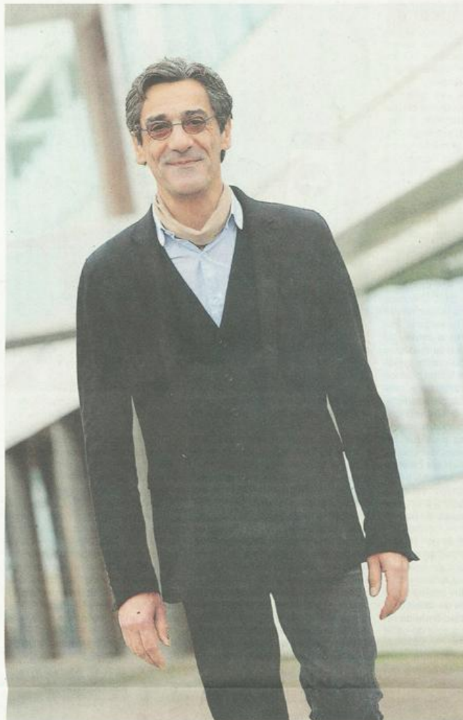
À 59 ans, Serge Papin, le fils d'épicier vendéen devenu PDG de Système U, tente d'allier grande distribution et responsabilité.

Tout ce qu'il s'était promis de ne pas faire. Plus dans sa nature pourtant. « Vous savez pourquoi, glisse-t-il dans un éclat de rire. Un comp-