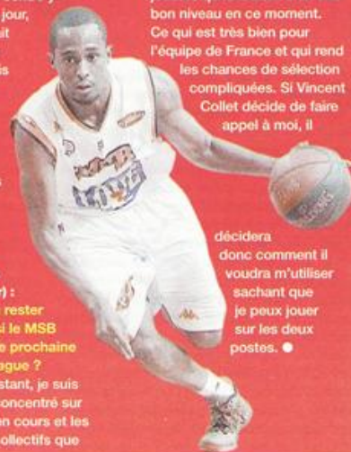
Basket Hebdo – Jeudi 05 février 2015

décidera donc comment il voudra m'utiliser sachant que je peux jouer sur les deux postes. ●