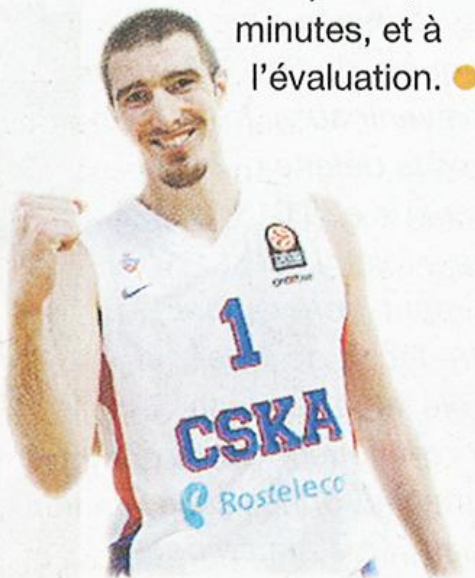
Basket Hebdo – Jeudi 05 février 2015

➤ Depuis la saison 2004-05 que le trophée de MVP du mois existe en Euroleague, Nando De Colo, élu meilleur joueur de janvier, est le premier Français à le remporter. Sur la période, le CSKA Moscou a gagné ses cinq matches du Top 16, avec une évaluation de 24,4 en 28 minutes pour le Français (18 points à 53,8%, 4,6 rebonds et 3,4 passes). En janvier, l'arrière a établi ses nouveaux records dans la compétition aux points, rebonds, passes, interceptions, minutes, et à l'évaluation. ●