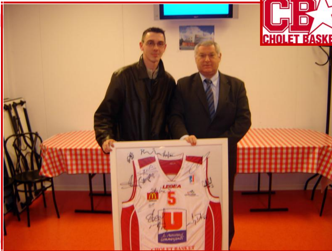
Le CE de MICHELIN gagne un maillot dédié par l'équipe