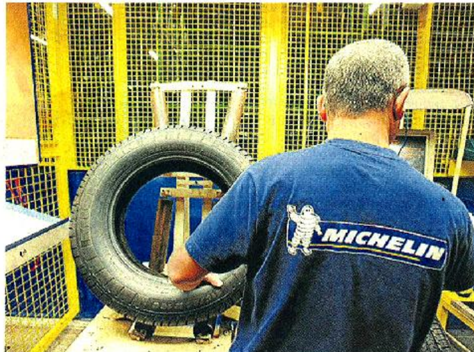
En février, l'usine a produit jusqu'à 17 000 pneus par jour, un record.

En février, l'usine a produit jusqu'à 17 000 pneus par jour, un record. « La moyenne de l'année s'établit autour de 16 000. Mais à terme, on pourra atteindre 20 000 », prévient le directeur. À terme, c'est potentiellement à la fin de 2012, quand la nouvelle ligne de production fonctionnera à plein. « Notre projet, en termes de capacité, est à l'heure. Et même un peu en avance », se félicite-t-il. Reste la conjoncture : « Nous avons des garanties, des certitudes jusqu'à la fin du premier trimestre 2012. Ensuite, ce sont des espoirs. Celui qui affirme avoir une visibilité au-delà est inconséquent. »