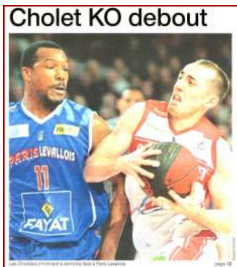
Quest France – Dimanche 18 janvier 2015