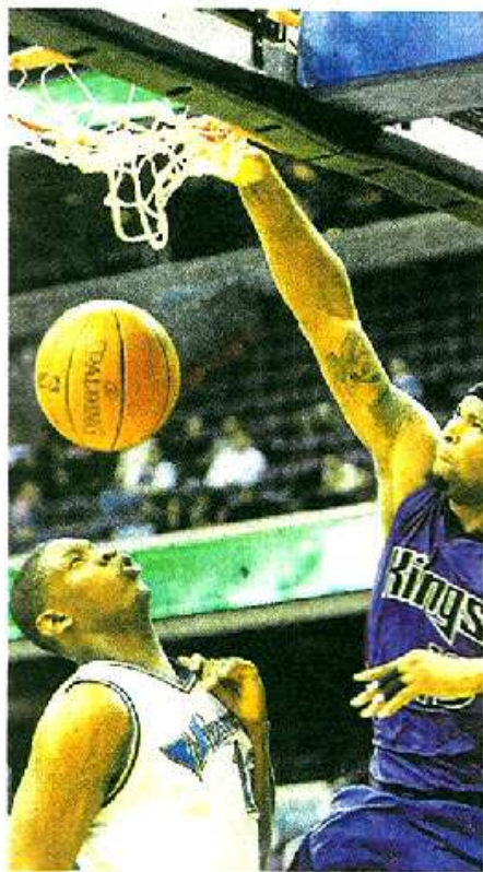
Kévin Séraphin face à DeMarcus Cousins, l'un des rares joueurs à le dominer physiquement.

Ses statistiques. Depuis ses débuts NBA, Kévin Séraphin tourne à 2,5 points et 2,5 rebonds par match, pour 9,3 minutes en moyenne. Il a joué 20 matches sur les 43 disputés par son équipe.