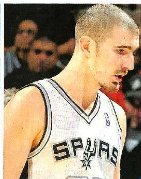
Rudy Gobert et Nando De Colo, joueurs NBA et anciens pensionnaires du centre de formation de CB.

tionnelle qualité de communication. Rudy est aussi là-dessus. Alors, on se dit qu'on a servi. Ces valeurs de respect, de proximité permettent de ne pas se cramer au premier croc-en-jambe.