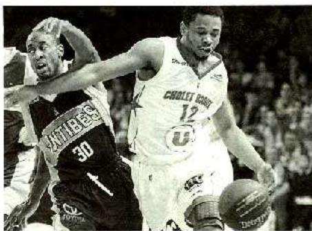
Stoglin et Cholet n'y arrivent plus.

ROANNE : Reid (10), Amagou (18), Inglis (3), Samnick (7), Sangaré (5), Lyons (1), English (15), Green (20).