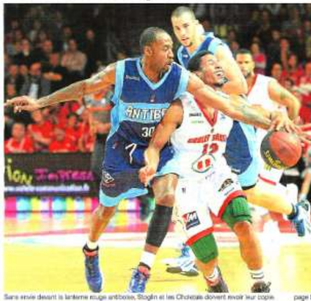
Sans envie devant la lanterne rouge Antibes, Stogin et les Choletais doivent revoir leur copie. page 5