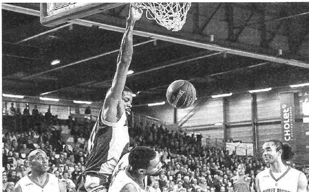
Les Choletais se sont fait marcher dessus par les Antibois, pourtant abonnés à la lanterne rouge de Pro A depuis le début de la saison.

« On va travailler encore plus dur, reprend le coach. Dès ce week-end, car qu'on ne vienne pas me dire qu'on est fatigué après un match pareil. Surtout que le club a tout fait pour que les derniers déplacements se passent dans les meilleures conditions possibles. » Donc, oui, CB va devoir phosphorer