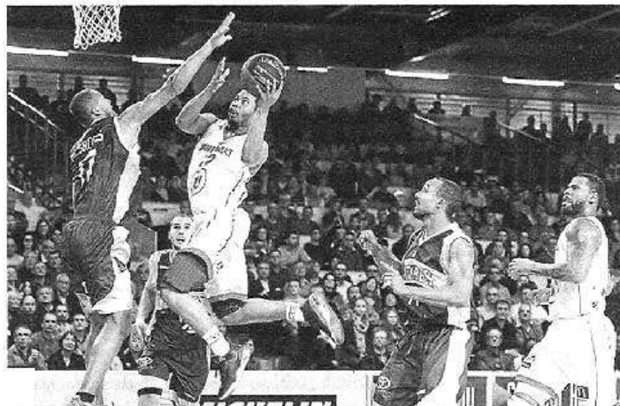
Stoglin et Cholet n'y arrivent plus.

Alors qu'il restait 7 secondes à jouer, et que Paris menait (86-78), une bagarre générale a éclaté entre les deux équipes. Les arbitres ont pris la décision d'interrompre le match. Des sanctions devraient être prises par la Ligue.