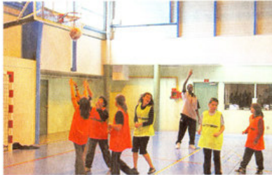
Paniers. Les jeunes n'ont sûrement pas tout appris du basket lors des séances d'entraînement et de la finale, mais ils ont montré une belle énergie, jusqu'à la fin de la compétition. Le tout dans la bonne humeur.