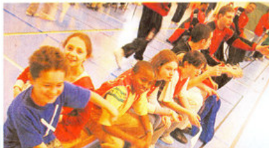
Sur le banc de touche. Ceux qui ne jouent pas encouragent les copains ou discutent avec les pros qui n'arbitrent pas. D'autres jeunes consultent la table de marque ou dribblent seuls dans un coin.