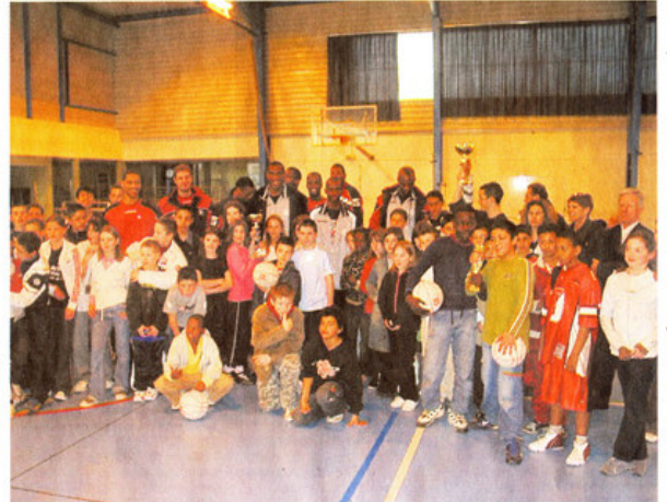
7 équipes en lice. La finale du tournoi des quartiers se déroulait mercredi. Les joueurs : 80 jeunes âgés de 10 à 14 ans venus de quatre quartiers du Choletais et regroupés par les centres sociaux Pastour, Horizon, du Planty et le Comité animation enfance. Ils se sont retrouvés au gymnase du lycée Sainte-Marie pour s'affronter sous l'œil de neuf pros de l'équipe de Cholet-basket. Au cours de trois séances d'entraînement, ils ont formé ces jeunes, qui pour la plupart n'avaient jamais joué au basket. Outre les coupes remises aux trois équipes ayant totalisé le plus de matchs remportés, un prix du fair-play a récompensé une formation. Le basket, ce n'est pas que de la technique, c'est aussi des valeurs.