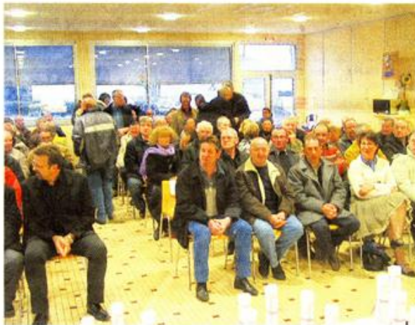
74 salariés de Nicoll ont reçu, hier, la médaille du travail pour leurs années de fidélité à l'entreprise. De 20 ans pour les médailles d'argent à 40 ans pour la couleur « grand or ».

Le plasturgiste choletais, propriété du groupe Aliaxis (2,4 milliards d'euros de chiffre d'affaires et 15 000 salariés) depuis 1980, a réalisé un bel exercice 2007. Le chiffre d'affaires a progressé de 7 %, « ce qui représente une performance au-dessus des tendances du marché ». Cette croissance a été entraînée par le fort développement de nouveaux produits, notamment dans les caniveaux et l'habillage de sous-toiture. L'export, qui compte pour 20 % de l'activité, a également contribué à ces bons résultats. Les ventes en Europe de l'Est ont augmenté, mais la Belgique, l'Italie et l'Espagne restent les plus gros