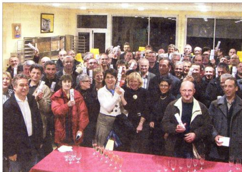
74 salariés de l'entreprise Nicoll qui en compte 1 000 à Cholet et 50 à Argenton-les-Vallées ont reçu une médaille du travail pour 20, 30, 35 ou 40 années de présence dans l'entreprise spécialisée dans la transformation du PVC