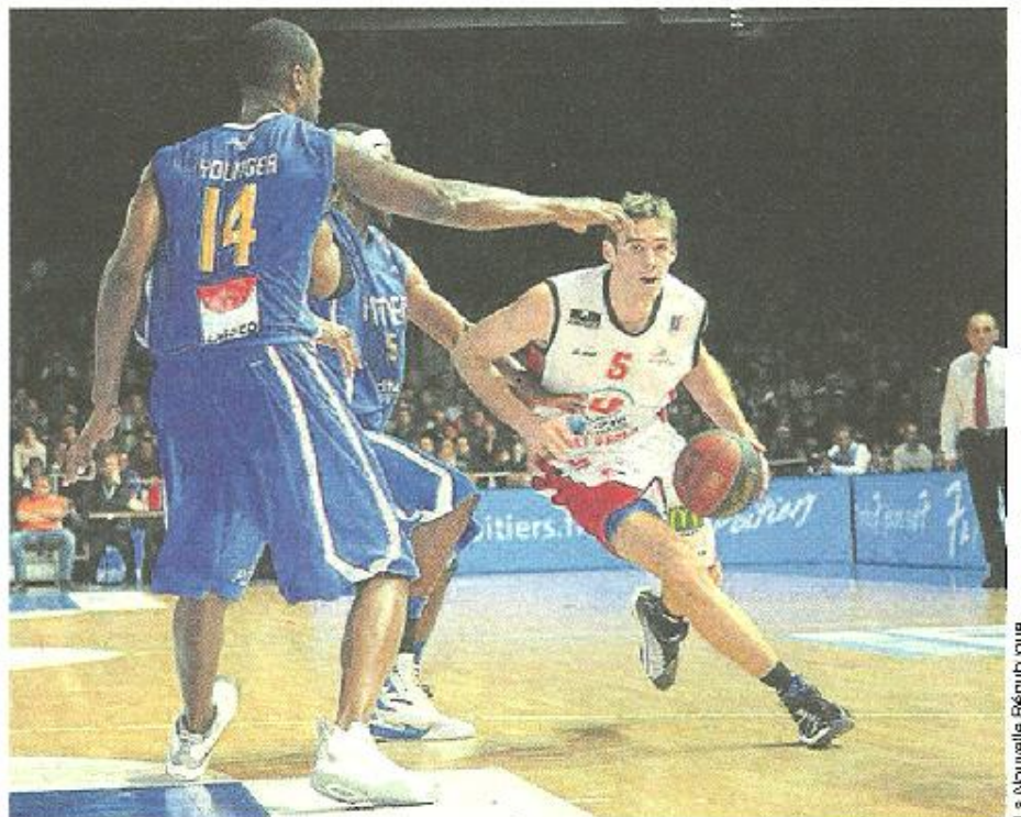
La Nouvelle République

Les protégés d'Erman Kunter semblaient avoir retenu la leçon et paraient les plus forts dans le troisième quart-temps. Causeur-Nelson, le duo fonctionnait et l'Américain s'éclatait à trois points (42-56, 27'). Le match semblait avoir définitivement tourné en faveur des visiteurs mais les Poitevins, qui jouent à chaque journée leur survie en Pro A, se rebellaient et recollaient à dix points à la fin de la période (49-59). Et même à six lorsque Fournier prenait sa chance à deux points (55-61, 33'). Cholet-Basket allait-il à nouveau flancher dans le dernier quart ? Non, pas cette fois.