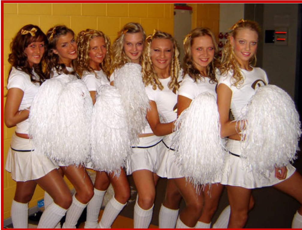
Les pom-poms girls assurent le show