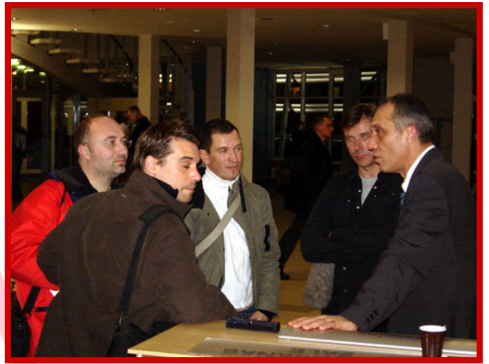
Discussions d'après-match entre les journalistes, le staff et les joueurs