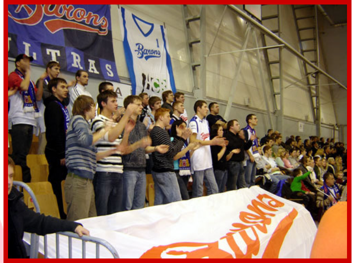
Un groupe de supporters lettons