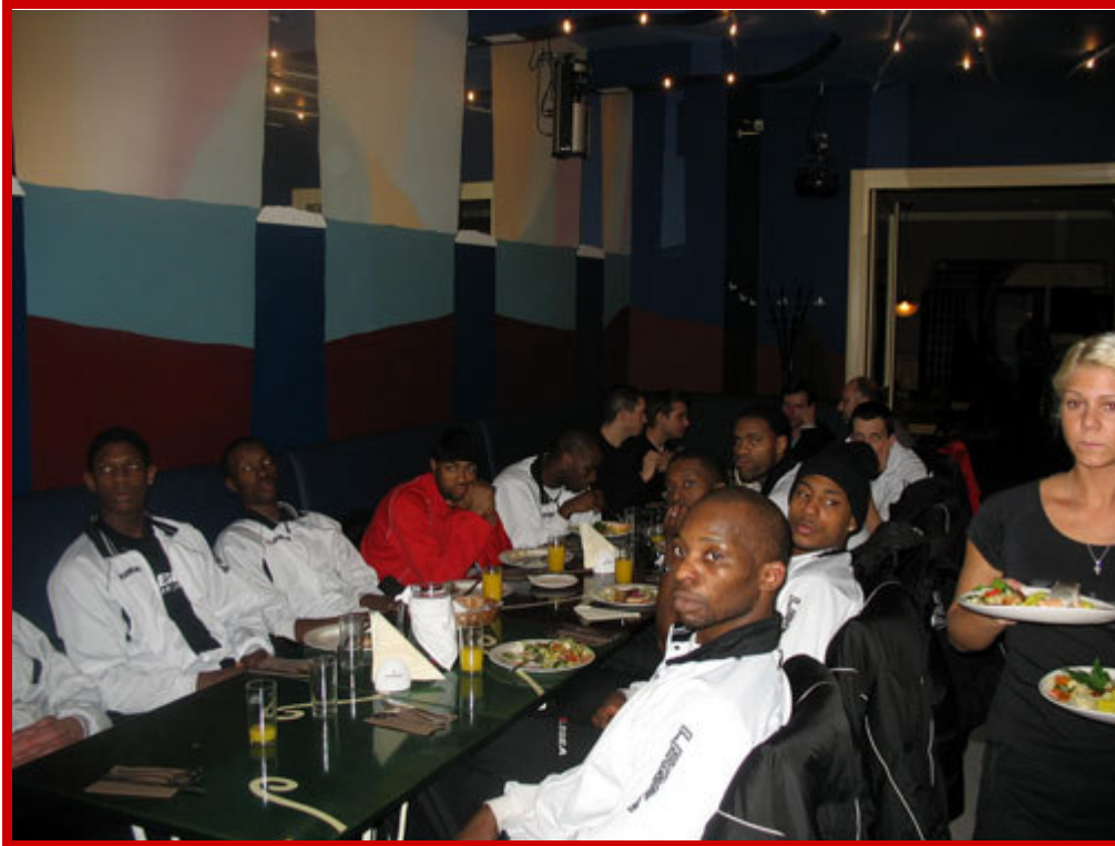
Dîner des joueurs, du staff et des journalistes dans le restaurant du club