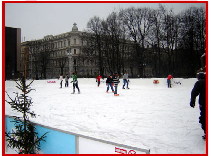
Les bonhommes de neige et les patinoires à même la ville