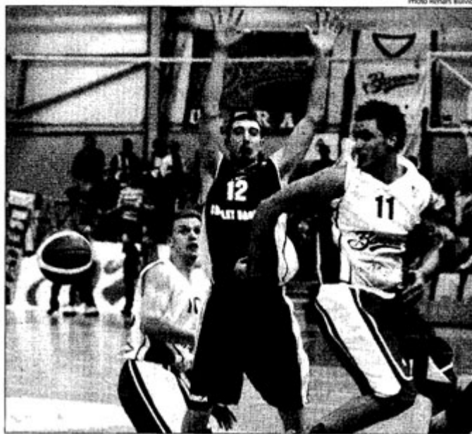
De Colo et les Choletais ont perdu gros mercredi soir à Riga

Le match contre Riga, mercredi soir, perdu dans les sec-teurs de l'intensité et de l'agressivité - les points forts de l'Américain - a remis le problème sur la table.