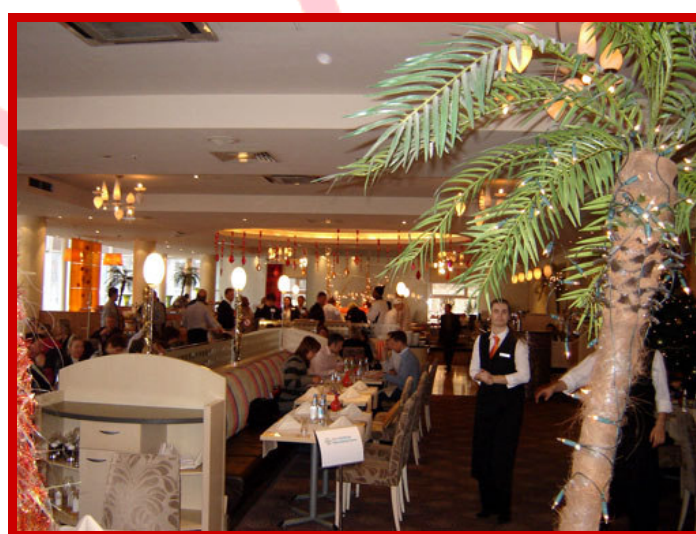
HOTEL REVAL où l'équipe a séjourné