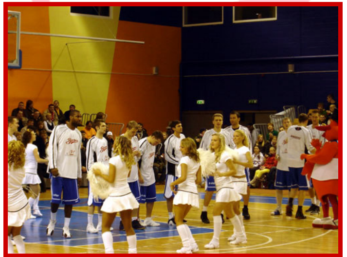
Présentation des équipes