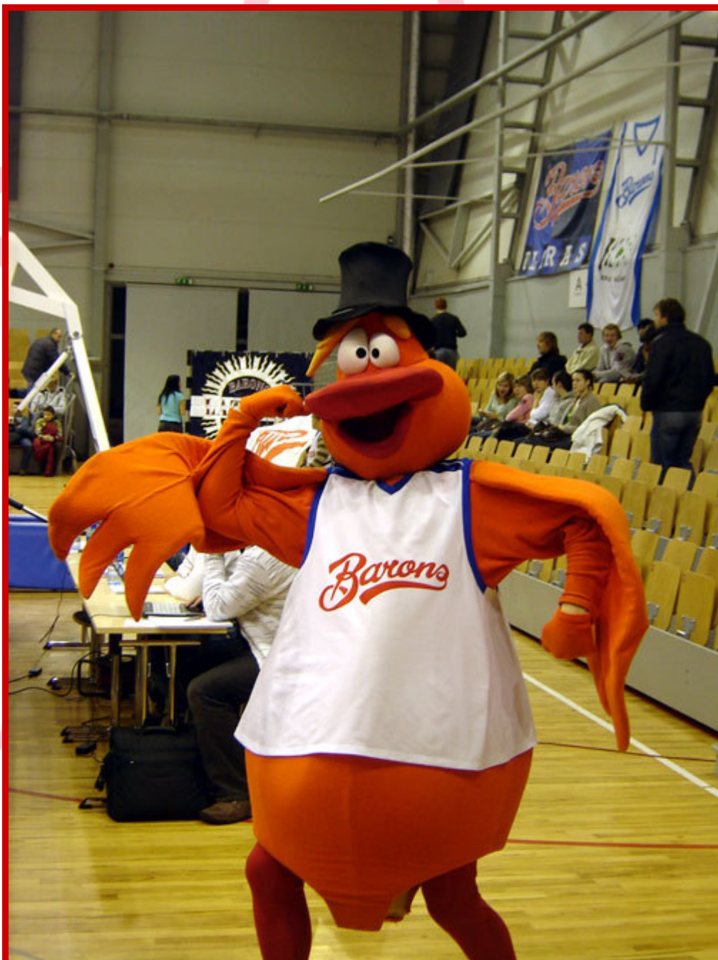
La mascotte du club

La salle de basket fait partie d'un complexe sportif qui abrite également du football indoor et une salle de musculation.