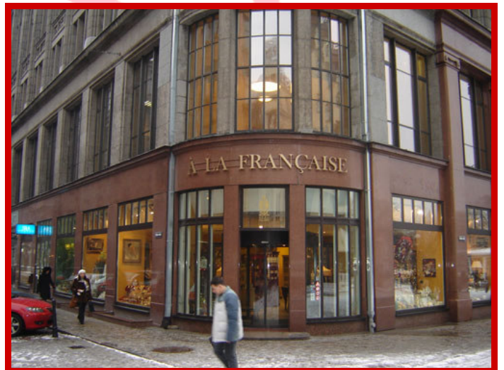
L'Ambassade France et un magasin de décoration "à la française"