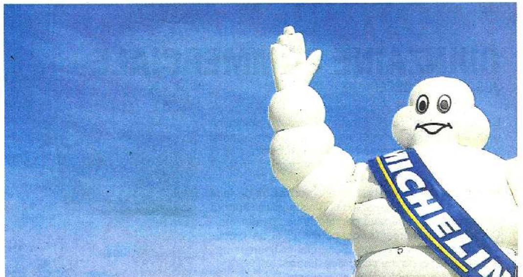
L'entreprise accueille chaque année 20 à 25 jeunes apprentis.

Cette proximité entre le monde enseignant et l'entreprise est établie depuis longtemps pour l'apprentissage et les niveaux CAP et BTS. C'est le cas notamment des BTS maintenance industrielle ou des CAP conducteur d'installations de production qui trouvent place chez Michelin. L'entreprise accueille chaque année 20 à 25 jeunes apprentis. Elle souhaite aujourd'hui s'inscrire dans un partenariat avec l'enseignement supérieur pour former des techniciens de niveau licence. « Il s'agit d'imaginer de nouvelles formations ou d'adapter les