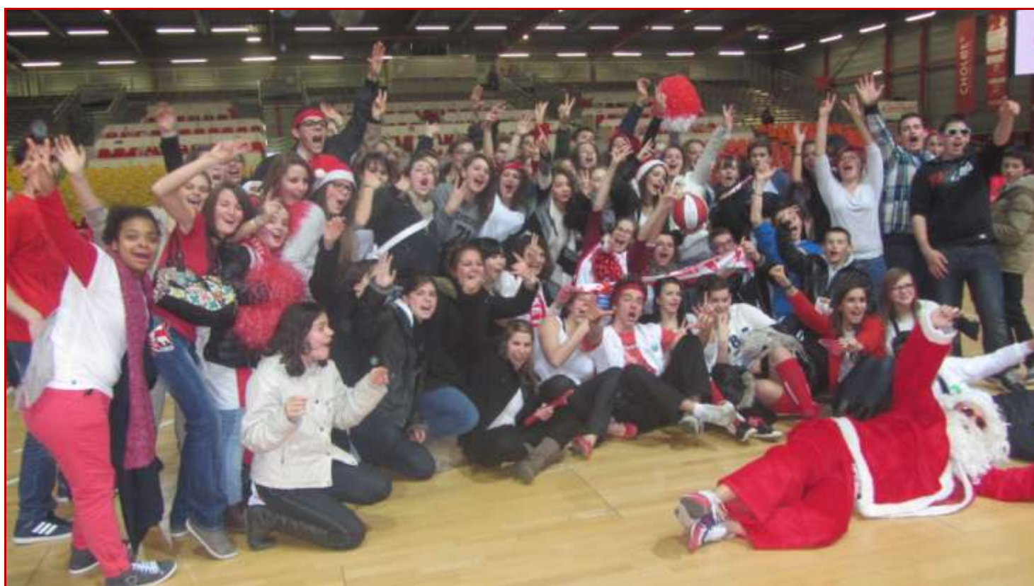
LA ROMAGNE (49) - MFR la plus dynamique et colorée