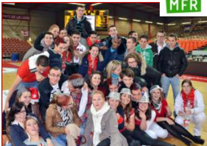
IREQ - LES HERBIERS (85)