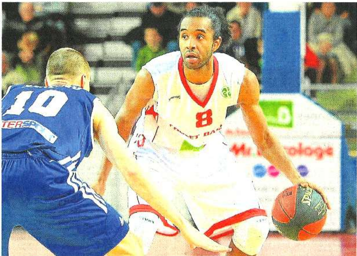
Avec cette victoire contre Kataja Basket, Cox and cie ont fait un pas de plus vers la qualification