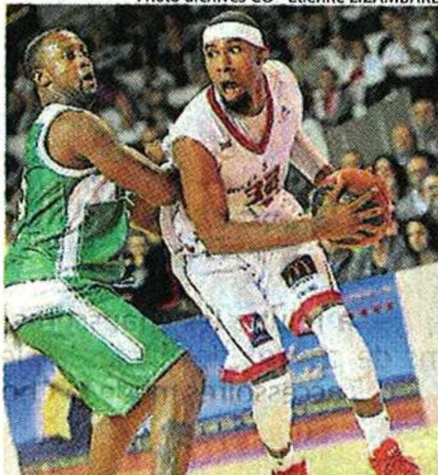
Cholet basket affrontera Kataja basket mardi 3 décembre.

Le Courrier de l'Ouest – Samedi 30 novembre 2013