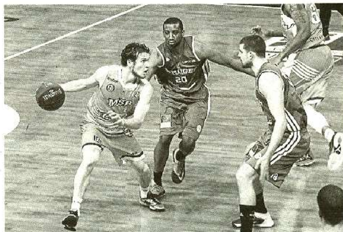
Vainqueurs au Mans, Moerman et les Limougeaudois prennent le fauteuil de leader.

Antibes - Chalons ..... 80-103 (14-30, 22-23, 18-27, 26-23) ANTIBES : De Jong (9), Blus (15), Solomon (9), Fein (13), Martin (5), Desroses (0), Ona Embo (5),