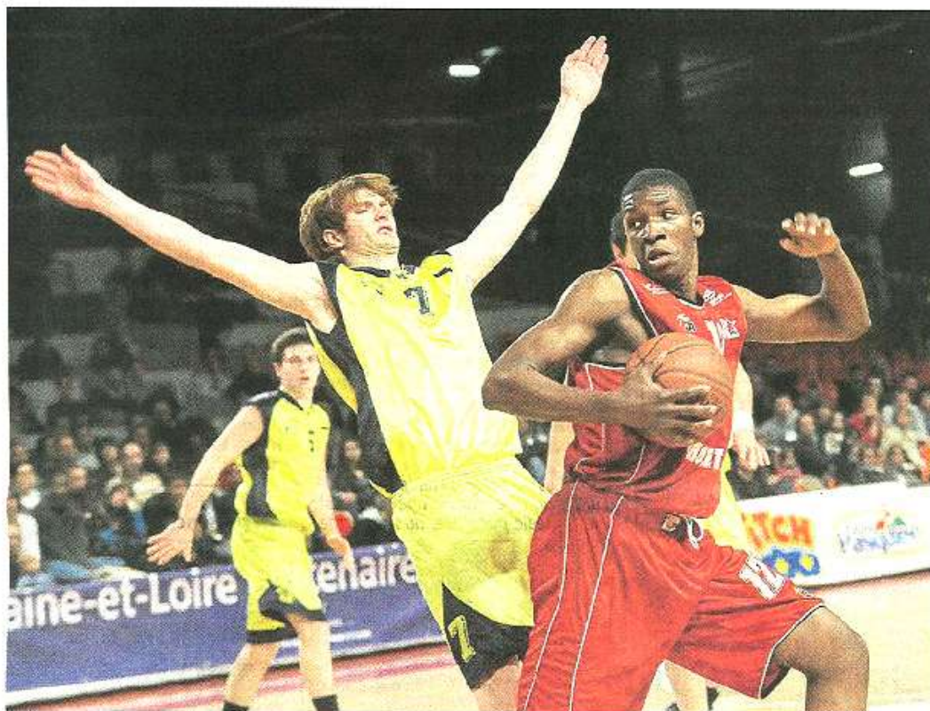
Cholet. Le Mondial Bodet Basket-ball voit évoluer chaque année les futures vedettes du ballon orange.

Autres éléments favorables, avec son projet sportif local, Cholet a concrétisé récemment des projets d'envergure comme les salles de sport Pierre-de-Coubertin, et la piste de BMX, deux installations inaugurées cette année. D'autres équipements vont voir le jour prochainement : le skate-park qui sera situé entre Glisséo et le plateau omnisports ainsi qu'une nouvelle salle Grégoire qui sera dédiée à l'escalade, au badminton et à la gymnastique rythmique. Enfin, la Ville de Cholet accueille volontiers des événements d'envergure, les initiant parfois, comme c'est le cas pour le Tour de Cholet, et la Nuit des trophées dédiée aux acteurs de la vie sportive. L'Open de beach-volley, la course cycliste Cholet Pays