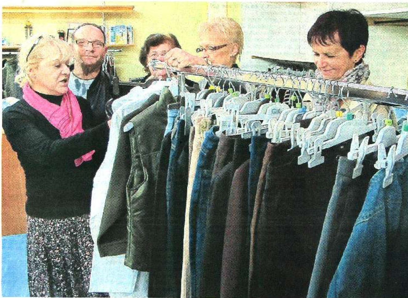
Cholet, avenue du Chêne-Rond, Secours populaire, hier. Une cinquantaine de bénévoles donnent de leur temps au service des bénéficiaires.

Le père Noël vert n'oublie pas les enfants défavorisés du Secours populaire. Il va leur distribuer des centaines de cadeaux, sous différentes formes, en ce mois de décembre. Petit tour d'horizon.