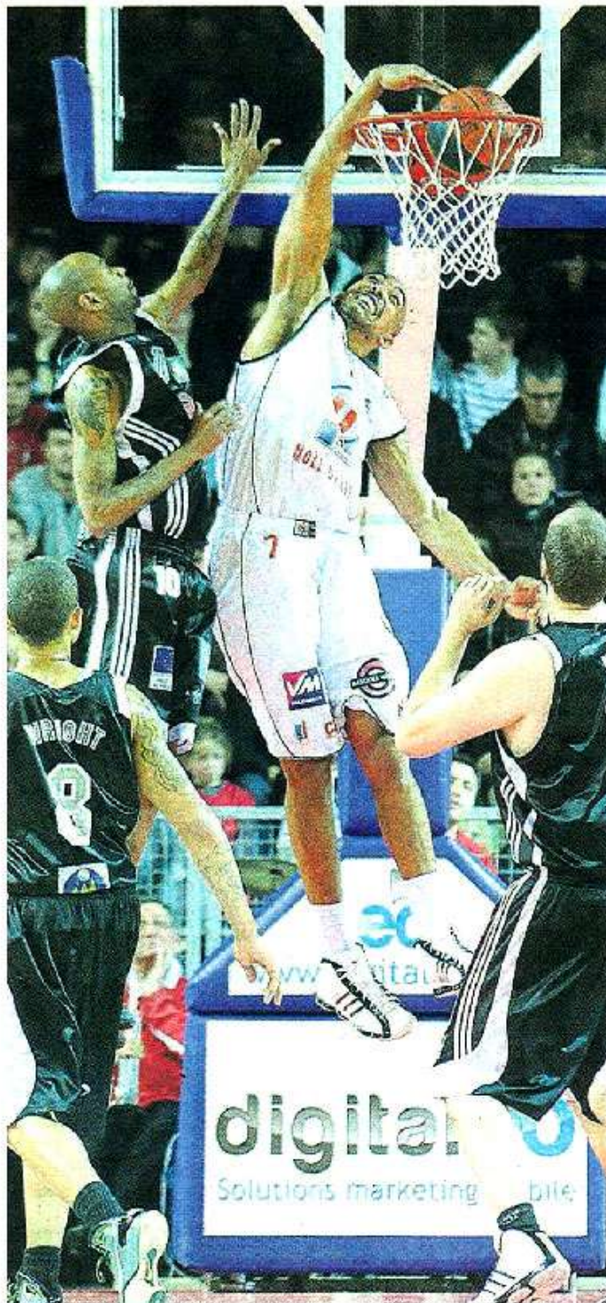
Cholet, La Meilleraye, samedi. Le secteur intérieur de CB reste performant. Grâce notamment à un Vebobe bondissant.

Exit Marquis donc. Re-bonjour Duport. Scotché sur le banc depuis trois matches, le grand