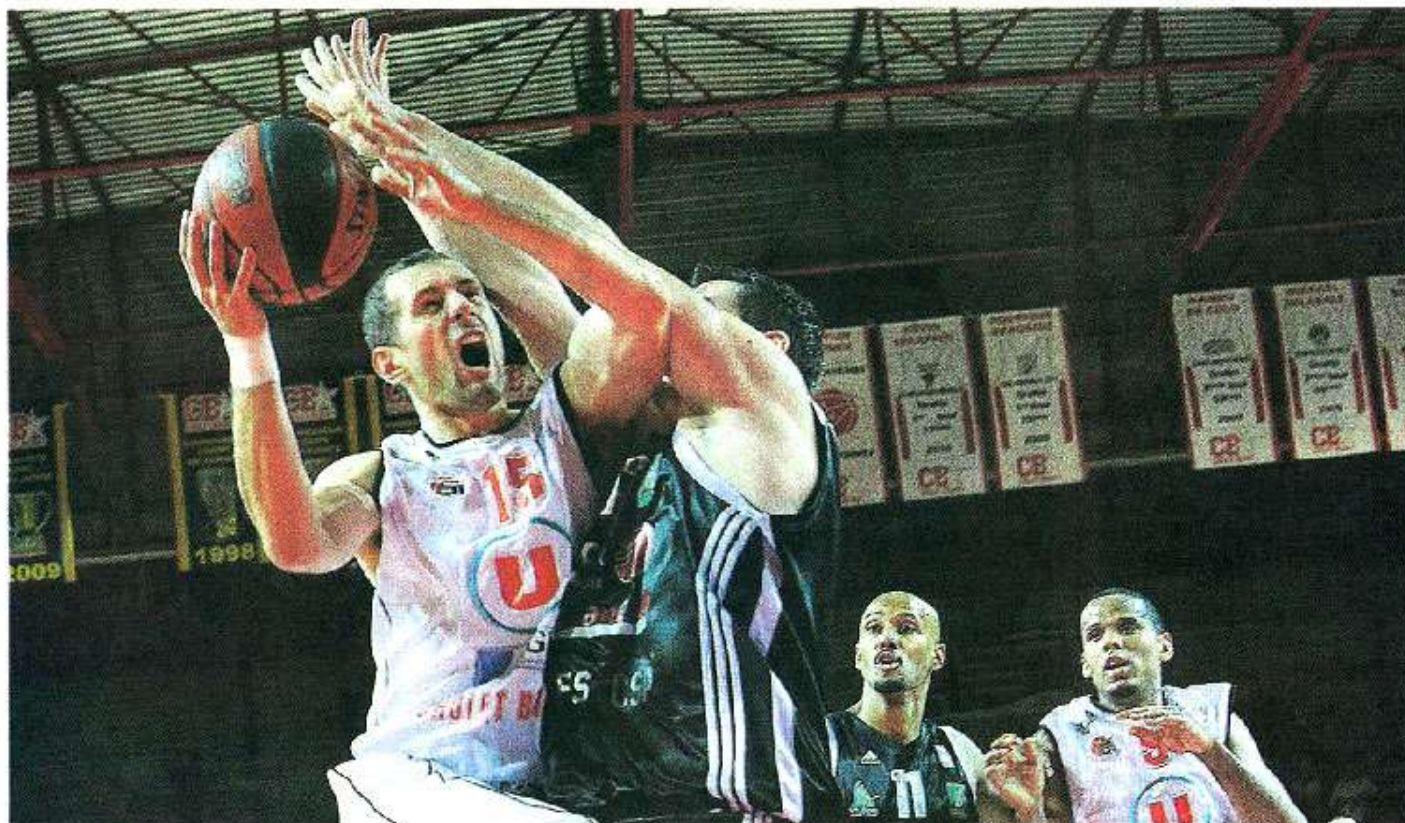
Cholet, La Meillerie, hier. Avdalovic s'arrache dans la raquette de Limoges. CB a eu besoin de lutter pour décrocher la victoire.

Les Choletais n'ont pas mis la manière mais ils ont pris le meilleur sur le CSP Limoges. Les voici en tête de Pro A à égalité avec les Roannais et Nancéiens, à qui ils rendront visite dans une semaine.