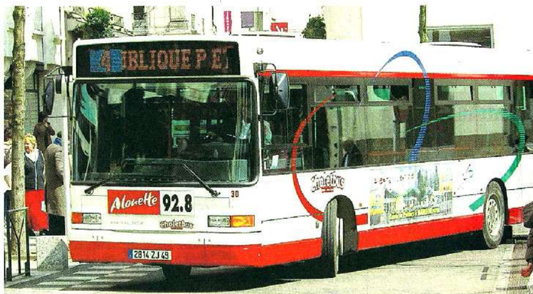
Les Transports publics du Choletais (TPC) emploient 72 salariés aujourd'hui.

Et de mettre en avant le panel de métier « de plus en plus large offert par les transports publics avec un appel croissant aux nouvelles technologies. Aujourd'hui, les conducteurs doivent apprendre à gérer les clients. Ils sont d'ailleurs formés pour ça. Les contrôleurs, eux, sont amenés à utiliser un système informatique de plus en plus pointu pour contribuer à la gestion du réseau. De leurs côtés, les mécaniciens travaillent sur des engins qui comportent une part croissante d'électronique. Quant au personnel du service marketing, il fait appel à des outils particuliers