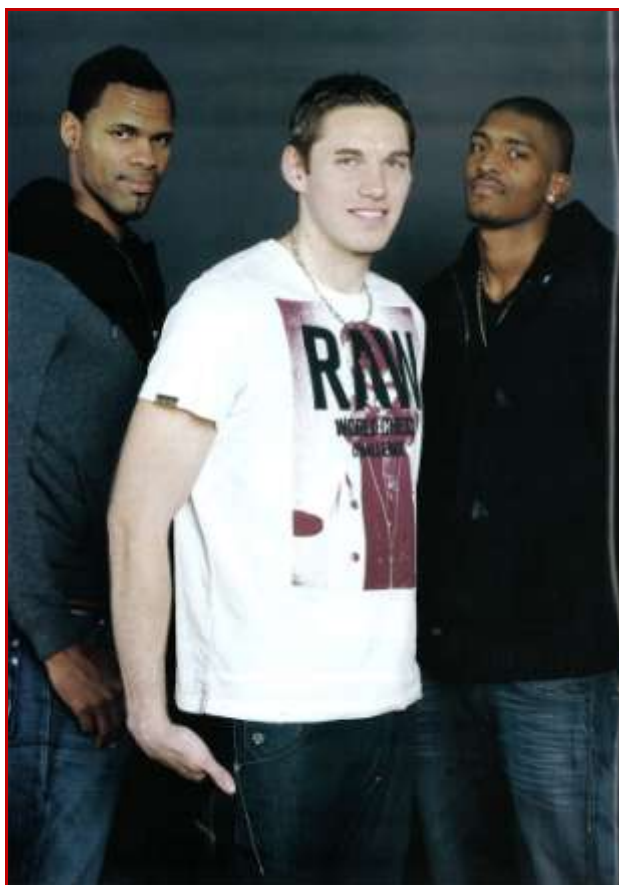
Maxi Basket n°27 – Janvier 2011