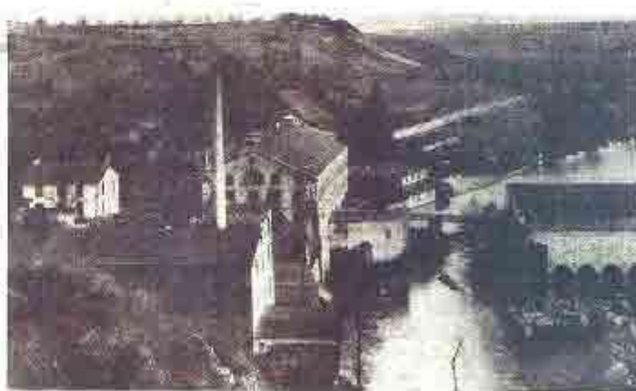
Le groupe Mulliez-Flory possède un site industriel de 11000 m 2 au Longeron.

Dans les années 1970, Mulliez se concentre sur les clients professionnels et en 1985, il crée deux départements, toujours en place : santé (blouses, linge de lit...) et vêtements d'image pour les entreprises. En 1992, Mulliez ouvre une filiale en Espagne avant d'être vendu en 1998 au groupe HDM spécialisé dans le