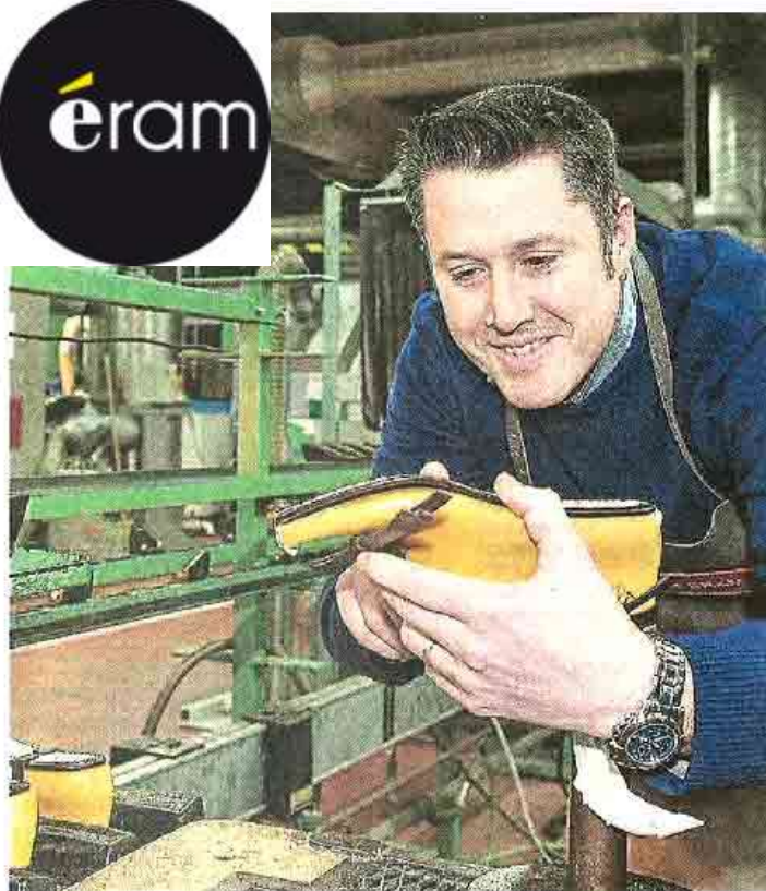
Chaque année, Eram fabrique 1,1 million de chaussures en France, sur 35 millions de paires vendues dans le monde.