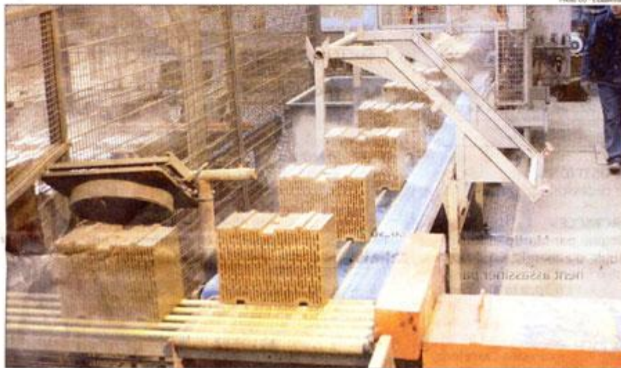
Déjà produite à La Séguinière, la brique de structure monmur l'est également à Saint-Laurent-des-Autels et le sera aussi bientôt en Vendée

L'investissement est de 20 millions d'euros et le nombre d'emplois supplémentaires prévus pour cette activité, qui complètera celle des tuiles de couverture et des briques de cloison, est de 30 à 40 personnes.