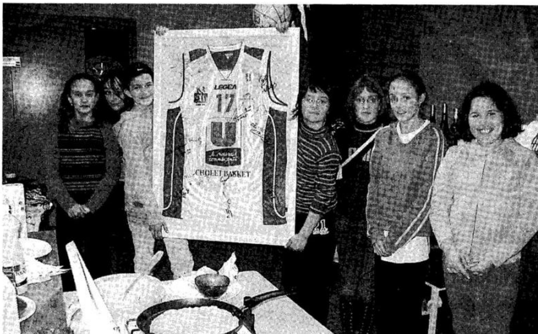
Les jeunes d'Aubry-Chaudron-basket au stand des crêpes.

Le club Aubry-Chaudron-basket a reconduit son action en faveur du Téléthon en reversant intégralement