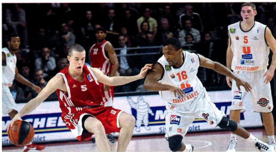
Sam. 14 nov. : nouvelle victoire de Cholet Basket (CB) face à Strasbourg, devant près de 4 400 Choletais, ainsi que les élus des communes de la CAC, venus encourager l'équipe phare de ce début de championnat de France Pro A où CB demeure en tête.

Synergences Hebdo N°171 - Vendredi 20 novembre 2009