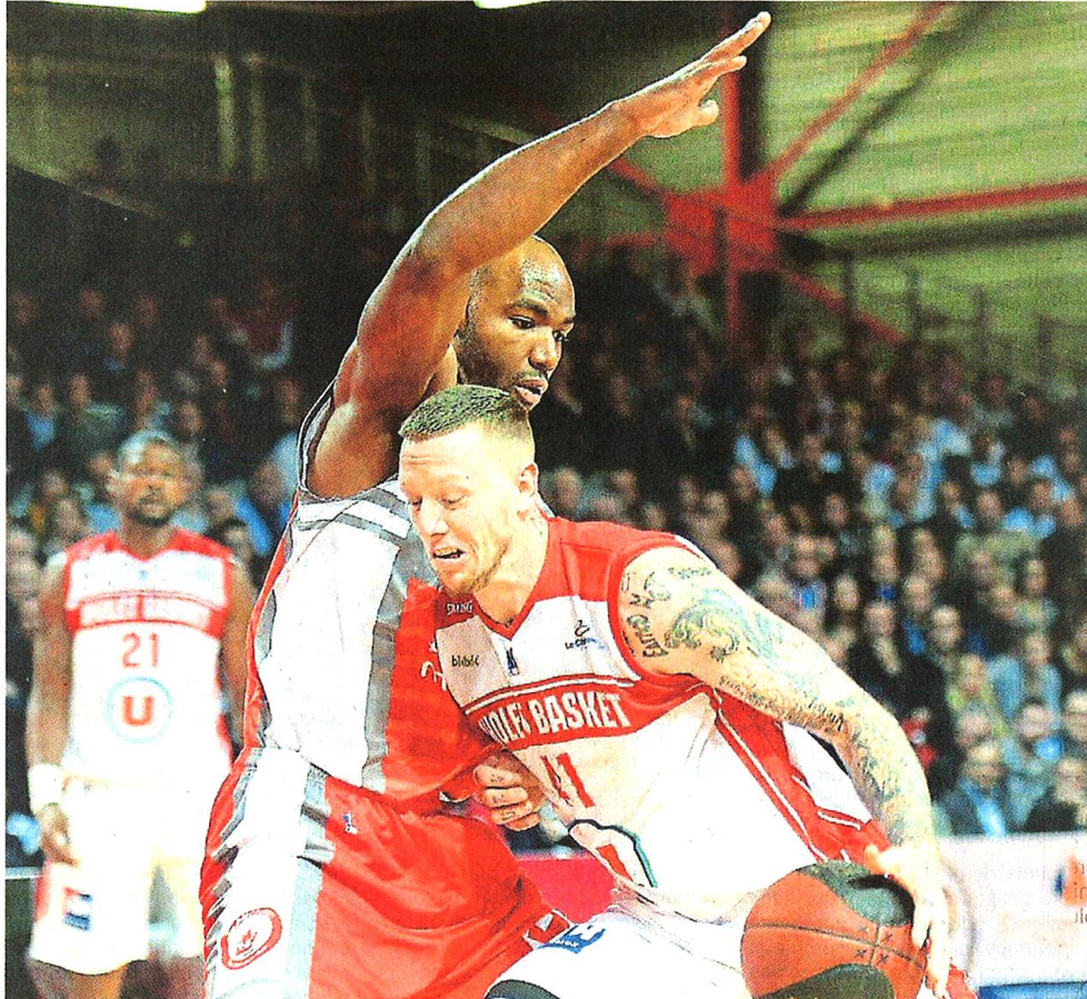
Minnerath (21 points) et les Choletais sont revenus à deux reprises sur les talons de l'Elan. Sans pouvoir passer devant.

La marque : Ireland 20, Rich 17, Suggs 13, Wallace 2, Dove 21 puis Bouteille, Gradit 5, Lessort, Evtimov 1, Michineau 2.